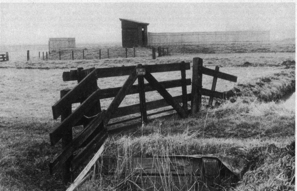
De zelfde hut, onderdeel van het landschap.

Nieuwe soorten uilenkasten, vleermuiskasten, hekken en borden zijn gauw gemaakt. Vogelobservatiehutten, daar heeft men meer werk en tijd voor nodig. In 1988 zijn twee observatiehutten gemaakt. Eén is geplaatst in het recreatiegebied Spaarnwoude (nabij de zeer vogelrijke Spaarn-