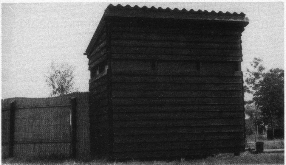
Een kleiner model dat in Spaarnwoude werd geplaatst.