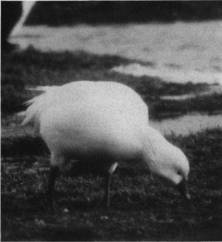
Ross' Gans, Weversinlaag, Schouwen-Duiveland, 23 februari 1991.