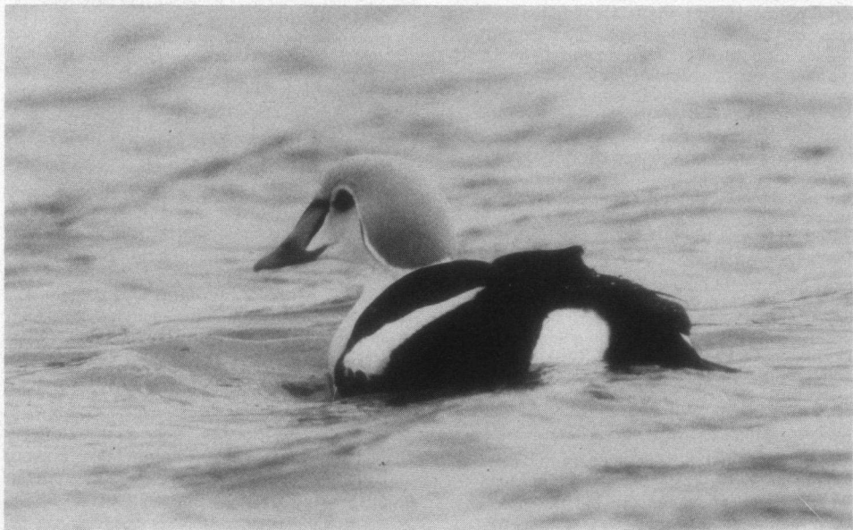
Koningseider, Nieuwe Waterweg, Hoek van Holland, 16 februari 1991.

Brandgans. 30-11-90 ca. 2000 ex. Anjum Kolken, Anjum, ca. 8000 ex. onder Ezumazijl, ca. 1600 ex. Bantpolder, tussen Anjum en Lauwersoog, 9-12-90 ca. 50 ex. dorp Piaam, ca. 40 ex. eendenkooi Piaam, ca. 80 ex. in weilanden langs Nieuwe weg Balk-Koudum. Hieronder 1 ex. erg wit met zwarte