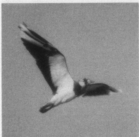
Kievit, nummer 4, gedeeltelijk albino. Zevenhuizen, 17 september 1989.

komen. Deze zes zijn nu alle gefotografeerd, aan de hand van de foto's 'op kaart gezet' en genummerd in volgorde van opkomst (zie tekening). Een dergelijke 'kaart' kan trouwens ook in het veld goed van pas komen, als hulp ter onderscheiding van de verschillende individuen.