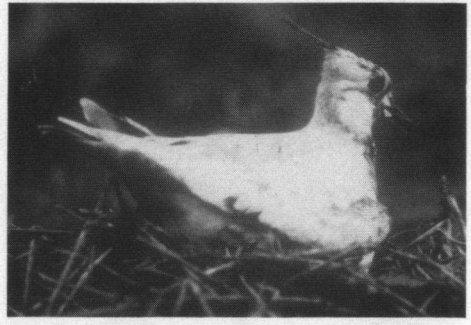
Twee foto's van één van schizochroistische wijfjes Kieviten bij Doorn, april/mei 1989.

■ Auke B. Terluin, Azaleastraat 20a., 3051 TG Rotterdam, 010 - 4 182 686