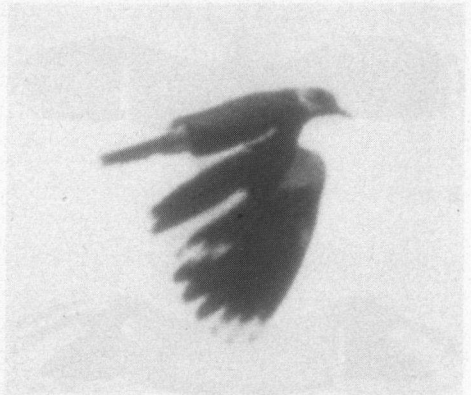
Kievit, nummer 6, gedeeltelijk albino. Zevenhuizen, 12 juni 1990.

ren er ook dit jaar weer vijf paren aanwezig, maar er werden tot in juni tien kievitlegsels gevonden (en niet geraapt natuurlijk!). Dat wil zeggen dat ofwel van alle paren het eerste legsel verloren is gegaan, ofwel dat enkele paren meer dan één legsel hebben gehad. De drie paren