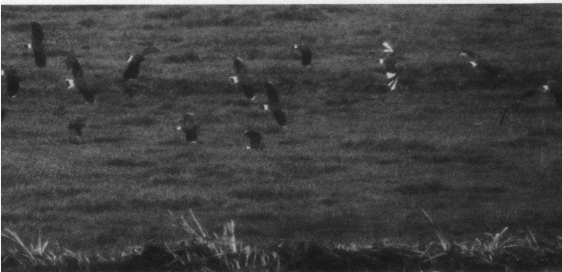
Kievit, nummer 5, gedeeltelijk albino, in groep Kieviten en Spreeuwen. Zevenhuizen, 28 september 1990.

Tot vorig jaar juli waren er te Zevenhuizen drie gedeeltelijk albino Kieviten opgemerkt en beschreven in 1.) en 2.). De eerste en oudste, vanaf 1982 al broedvogel aldaar, is vanaf medio juni 1989 niet meer gezien. Dat deze vogel in acht broedseizoenen voor een aanzienlijke verspreiding van albinisme binnen de plaatselijke kievitenpopulatie heeft gezorgd, moge wellicht blijken uit het feit dat het aantal verschillende partieel albinistische Kieviten nu reeds op zes is ge-