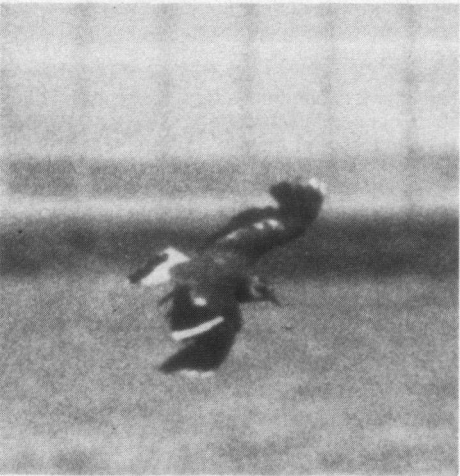
Kievit, nummer 3, gedeeltelijk albino. De kleine witte vlekjes zijn het gevolg van rui. Zevenhuizen, 15 juni 1990.

In het voorjaar (van 1990) werden de weidevogel-nesten in het poldertje voor het eerst gemarkeerd om schade, door vroege werkzaamheden op het land, te kunnen voorkomen. Men begon hiermee op 6 april, onder auspiciën van de Natuur- en Vogelwacht 'Rotta'. Van de Kievit wa-