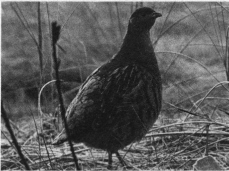
Ook de Patrijs staat op de lijst!

effect'? (dat wil zeggen profiteren andere soorten mede van het plan?).