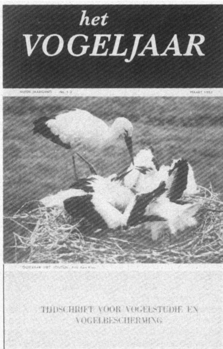
Omslag van 'Het Vogeljaar' nummer 1-2 van de vijfde jaargang (maart 1957) toen nog zwartwit foto's het omslag sierden.

denen in vogels zijn geïnteresseerd of eenvoudig van vogels houden en de meer gevorderde avifaunisten die elke vogelsoort willen herkennen en die tot het verrichten van tellingen en inventarisaties bereid en in staat zijn.