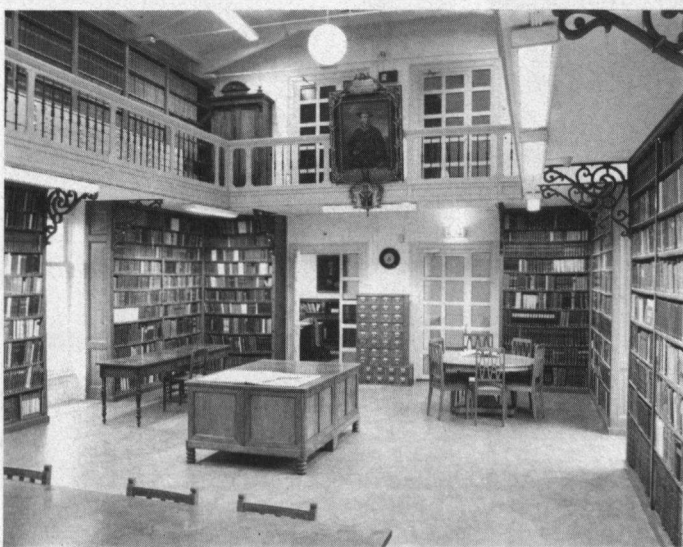
De monumentale boekenzaal van de Artis Bibliotheek.