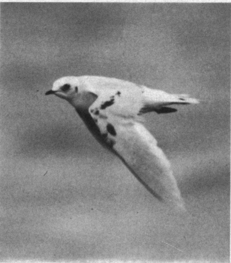
Ross' Meeuw, Zuidpier, IJmuiden, 21 november 1992.

Overigens heeft de Ross' Meeuw een kleine zwarte snavel en korte donkere (roodachtige) poten en geen zwart in de vleugelpunten. De vogel