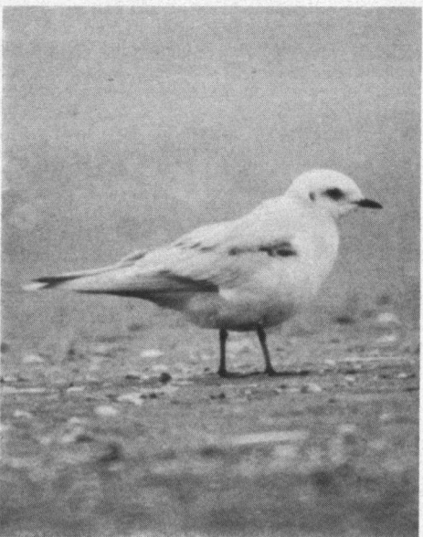
Ross' Meeuw, Zuidpier, IJmuiden, 23 november 1992.

is tot en met 24 november door vele vogelaars gezien en het betreft de derde waarneming van deze soort voor ons land. De vorige waarnemingen waren van 6 juni tot en met 15 juli 1958 op Vlieland een vrouwtje in zomerkleed en op 17 en 18 januari 1981 bij Camperduin, een volwassen exemplaar in winterkleed.