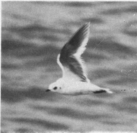
Ross' Meeuw, Zuidpier, IJmuiden, 22 november 1992.

De waargenomen vogel werd gedetermineerd als een exemplaar in tweede winterkleed of bijna