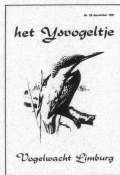
Omslag van het verenigingsblad.

zoals die van Maastricht, Geleen, Sittard, Roerstreek, Weert en Heihof. Deze groepen hebben zichzelf taken opgedragen zoals het meedoen met de programma's van Sovon (BSB-BMP), watervogeltellingen, huiszwaluwinventarisaties en dergelijke. Daarnaast zijn er themagerichte werkgroepen zoals de Werkgroep Heihof (nestkastenproject), de Werkgroep Publiciteit die zo veel mogelijk contacten onderhoudt met de Limburgse bevolking, de Werkgroep Vrije Vogelreservaten, de Werkgroep Vogelfotografie enzovoort. In de Schinveldse Bossen is door het toedoen van de Werkgroep Heihof een wand voor Oeverzwaluwen tot stand gekomen. De Vogelwacht Limburg richt zich ook heel duidelijk op de overheid en werkt actief samen met andere organisaties om tot oplossingen voor gerezen problemen te komen. Als lid van de Limburgse Milieufederatie heeft de organisatie een belangrijke taak bij bijvoorbeeld herinrichtingsplannen, ruilverkaveling en bestemmingsplannen. In 1984 werd samen met de Stichting Mondiaal Alternatief actie gevoerd om bekendheid te geven aan de penibele situatie waarin de Limburgse Ortolanen verkeren. Onlangs is een actie gestart om de nestgelegenheid van Gierzwaluwen in de daken van in de jaren zestig gebouwde flats te ver-