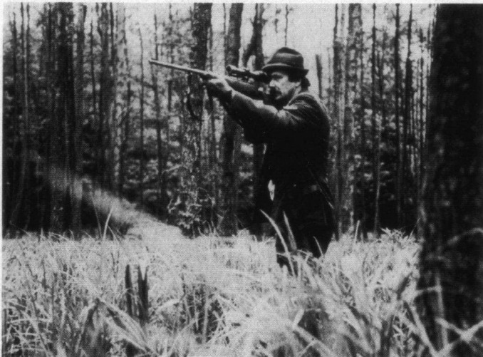
Zijn plezierjagers 'rentmeesters' van de natuur?

Hoe sportief is deze jacht nu eigenlijk, hoe flink is deze 'uitdaging', want hoeveel kans heeft het wild om te ontsnappen, ook al ben je volgens de