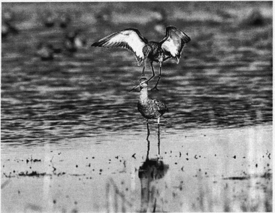
Ektar-filmprijs, Grutto's, Ackerdijk, gemeente Pijnacker, 3 april 1994. Leica R4, 560 mm, F 11, 1/1000, Ektar 1000.