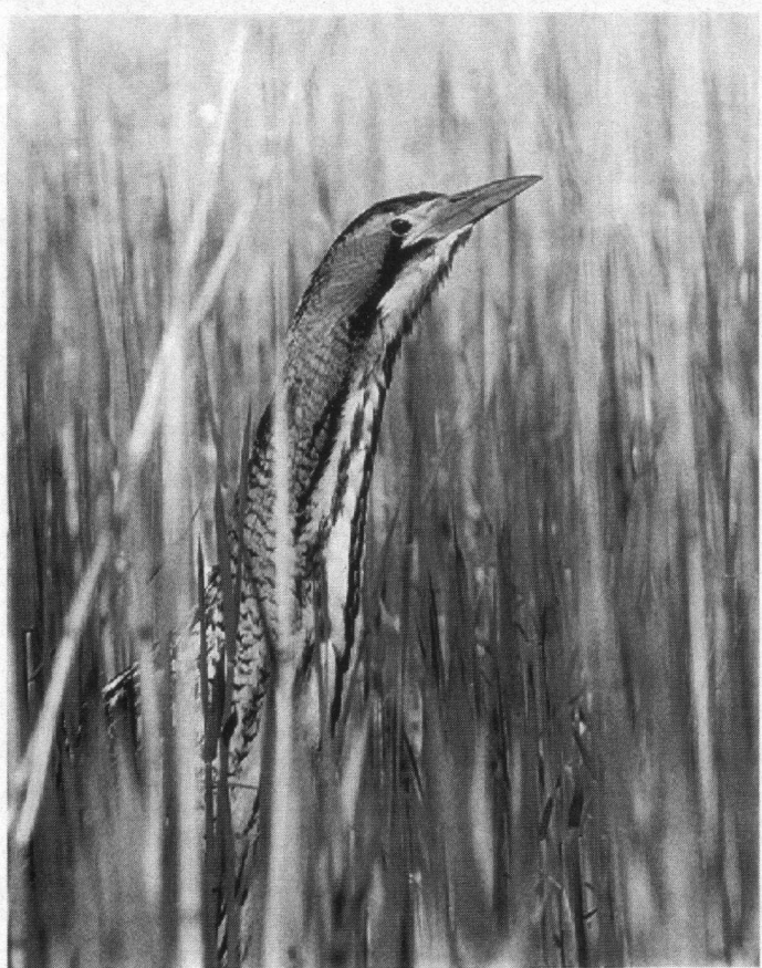
Elite-filmprijs, Roerdomp, Amel- de, 5 mei 1994, Pentax MX + Leitz 560 mm, 1,4 converter.