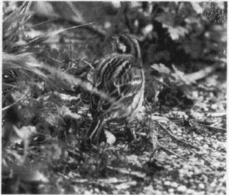
Wiltkoppogor, 1ste winterkleed ♂, IJmuiden, 22 oktober 1994.