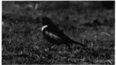
Beflijster, Noordduinen, Katwijk aan Zee, 14 april 1996.

Grote Gele Kwikstaart. 15-12-95 1 ex. Nieuw Kanaal, AW-Duinen, (P. Tak, P. de Droog); 18-5-96 1 ex. Kaliwaal, Ooijpolder (P. Tak, P. de Droog, J. van Blanken, T. & M. van Dijk); 6-6-96 1 ex. in prachtkleed, Bolmert, gem. Roden (W. van Amerongen). Rouwkwikstaart. 23-4-94 ♂ Breskens (V. van der Spek en vele anderen); 14-6-94 1 ex. Tweedevand El, Haarlemmermeer (J. Groen); 2-4-95 ♀ Boschplaat, Terschelling (J. Jes); 5-5-95 gemengd paar (met Witte Kwikstaart) broedend, haventerrein, Lauwersoog (A.H. Bulthuis); 14-5-96 1 ex. Houtrakpolder bij Haarlem (P. Tak); 2-6-96 ♀ Quackjeswater, Rockanje (H. Gaasbeek).