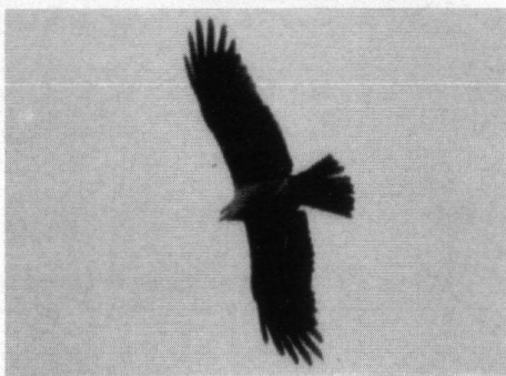
Zwarte Wouw, Den Oever, 19 mei 1996.

Zwarte Zeeëend. 12-3-96 ♂ stervend, Zuiderhoofd, Harlingen (E.W.F. Brandenburg); 8-4-96 circa 600 ex. Zuidpier, IJmuiden (P. Tak).