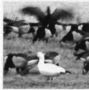
Ross' Gans, Plaats van Scheelhoek, Stellendam in groep Brandganzen, 22 februari 1997.

Amerikaanse Smlent. 25-2-97 1 ex. Lauwersmeer, door velen bevestigd (fam. Sietsma); 5-3-97 1 ad. ♂ tussen ca. 200 Smlenten. Kleed: kopkap met witte bles, zijkant kop bronsgroene vlek, keel en hals egaal streperig, flanken roze met horizontale witte streep, dekveren grijs met wat afhangende witte puntje sierveren. Rijsplas, Aalkeet-Buitenpolder, Vlaardingen (H. Gaasbeek).