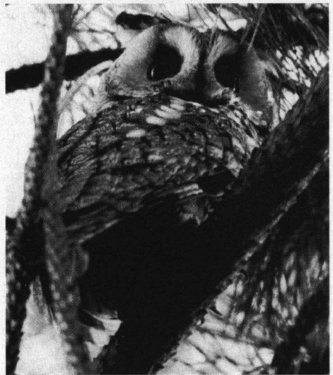
Eén van de 23 Ransuilen die overwinterde in de bebouwde kom van Bunschoten in de winter 1996-1997.