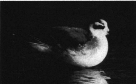
Rosse Franjepoot, Kennemermeer, AW-Duinen, 24 februari 1997.

Rosse Franjepoot. 24-2-97 1 ex. enkele dagen op Kennemermeer, AW-Duinen, zie foto (J. van 't Hof, K.J. Eigenhuis).