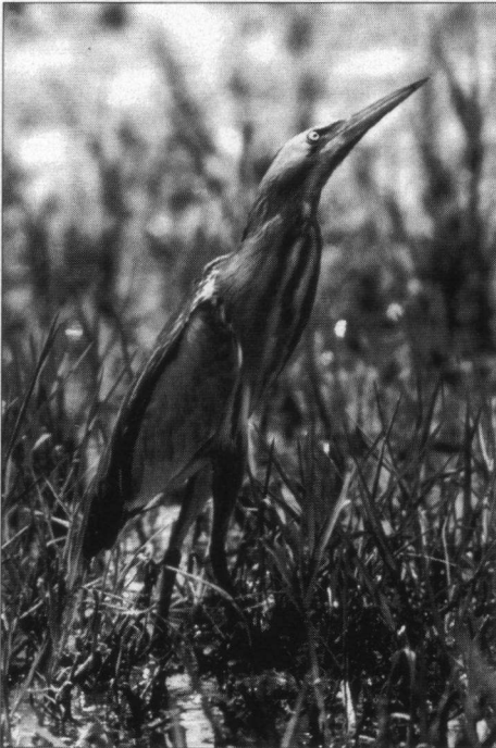
In de Polder Schieveen komen dan wel geen Woudaapjes meer voor, maar nog wel Grutto's en Tureluurs.

Na De Mokkebank gaat het door naar de Steile Bank, naar schrijvers smaak één van de fijnste