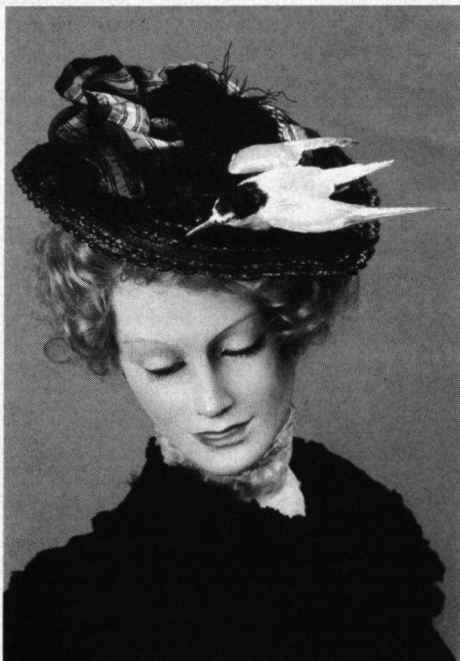
Opgezette sterns en vogelveren op hoeden waren een eeuw geleden, aanleiding tot oprichting van Vogelbescherming. Foto: B. Muller/FN, uit de collectie van Tiny Meihuizen, Utrecht.

Tot de weinige lichtpunten behoorden de vele nieuwe, voor vogels aantrekkelijke wateren en drasgebieden die met de stormachtige economische en ruimtelijke ontwikkeling ontstaan: drink-