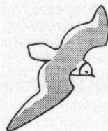
Vignet van Dutch Birding beeldt een Ross'Meeuw uit, getekend door Dirk Moerbeek.

De meeste kolonies liggen bij een water. Daaromheen natuurlijk een bomenrij. Dierentuinen blijken ook favoriet voor de Blauwe Reiger om met andere te broeden.