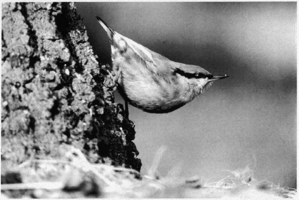
Ervolle vermelding: Boomklever, Doorn, februari 1996. Nikon 500 mm, AGFA 100 ASA.