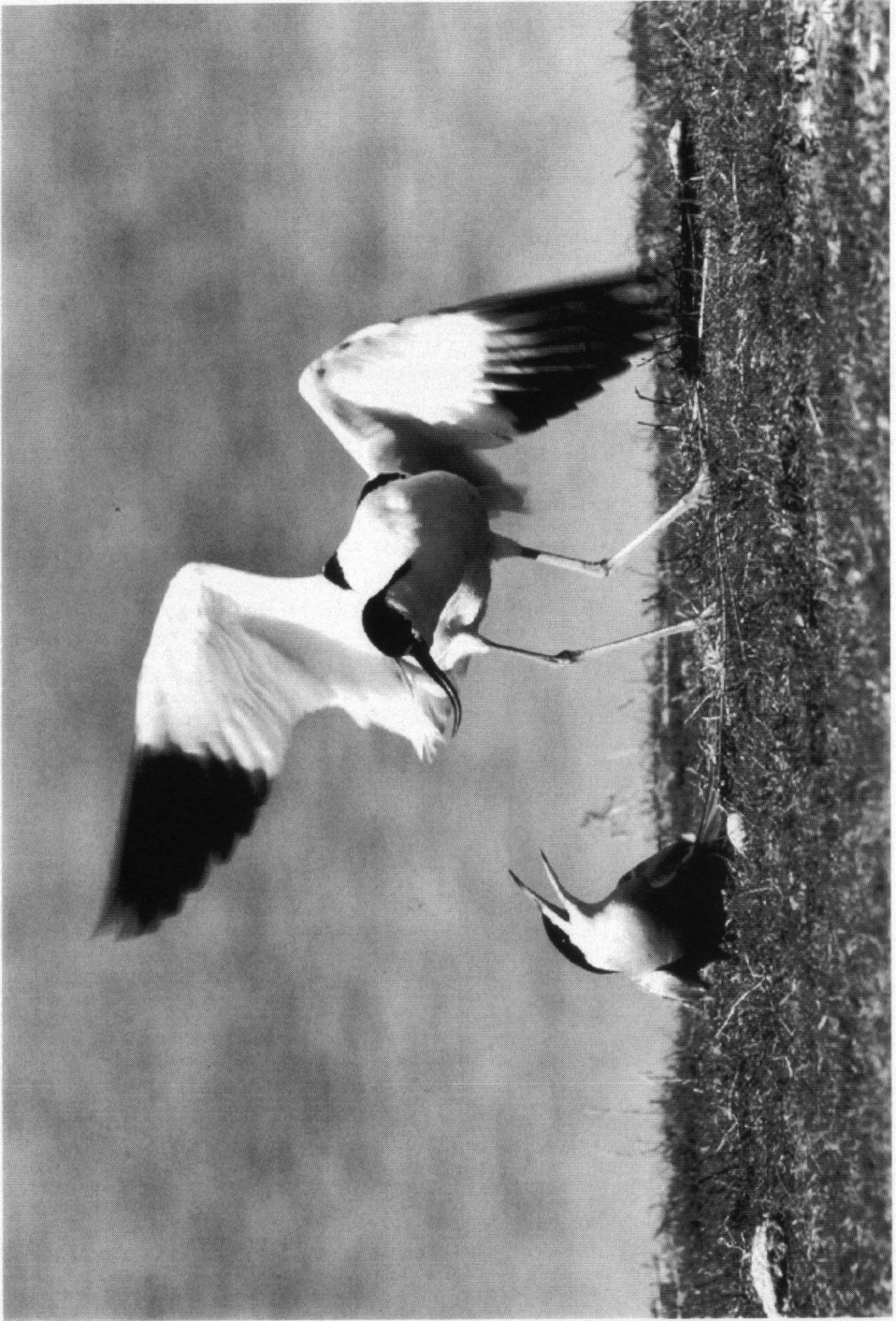
Eerste Prijs: met elkaar vechtende Kluut en Vledlef, Nikon F5 met 500 mm AF-IF en 1,4 converter.