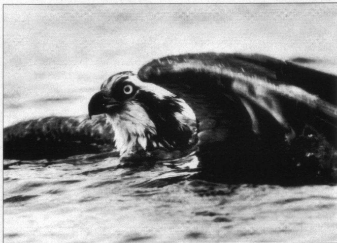
Visarend, zwemmend.