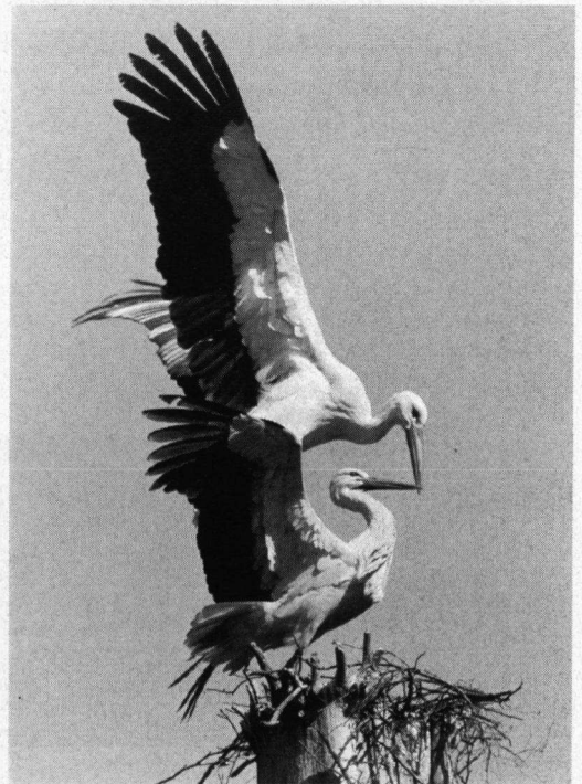
Parende Ooievaars, Kralingse Bos, Rotterdam, 7 april 1997. Nikon F90X, Sigma 400 mm, F 5,6.

Deze foto krijgt de Eerste Prijs (f 750,-) . Deze opname werd vooral gewaardeerd omdat er twee verschillende soorten zijn afgebeeld. De vogels