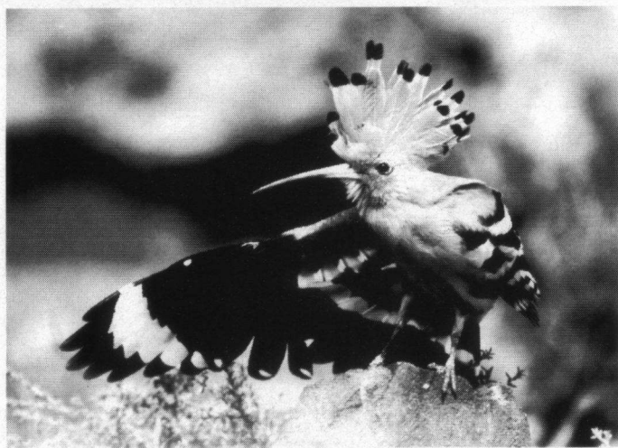
Hop, vleugel strekkend, met opgezette kulf, Fuertaventura, Canarische Eilanden, 21 febru- ari 1998. Nikon F 801S, Nikon 600 mm, F 4 met Nikon 1,4 converter, F 5,8, 1/250 seconde.