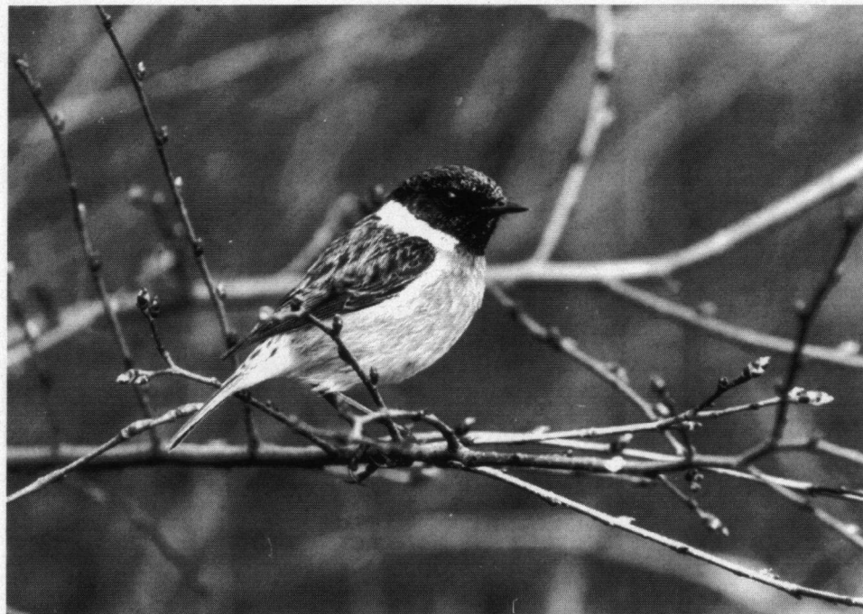
Eervolle vermelding: Roodborsttapuit, mannetje.