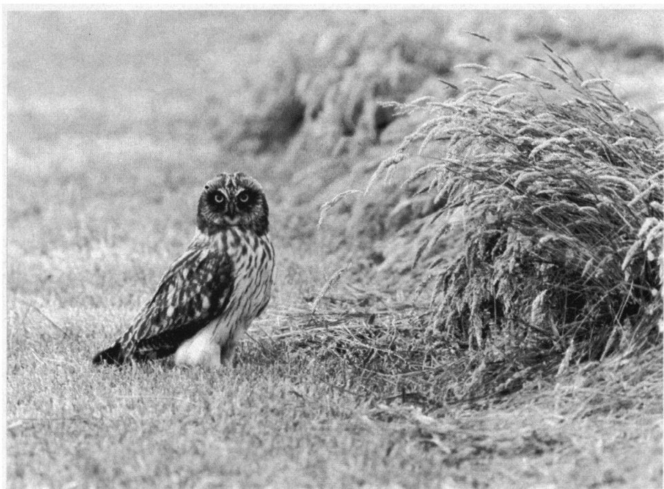
Tweede Prijs: Velduil, Ameland, juni 1998.