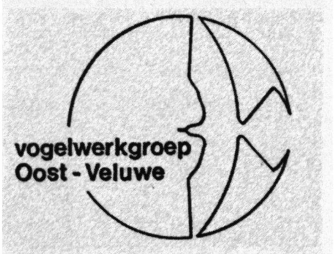
Vignet Vogelwerkgroep Oost-Veluwe.

Op zijn homepage zien wij een IJsvogel ( Alcedo atthis ). Wie daarop klikt kan diverse vogelfoto's bekijken. Een prachtige foto van een Bokje ( Lymnocyrtus minimus ) en van een Waterpieper ( Anthus spinoletta ). Het is heel prettig dat de foto's in enkele seconden kunnen worden binnengehaald. Zo zijn er tweëntwintig schitterende foto's te bewonderen.