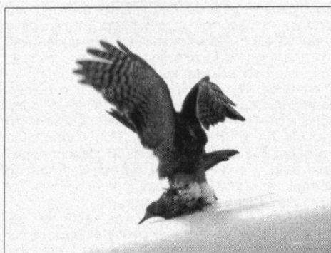
De Sperwer heeft de geslagen Bonte Strandloper meegenomen naar een hoger piekje.

Het voorkomen van deze Sperwers op zee past goed bij wat het handboek Birds of the Western Palearctic (BWP) vermeldt over de trekbewegin-