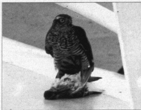
Op anderhalve meter afstand van de fotograaf stortte de Sperwer zich op een Bonte Strandloper. Gezien de grootteverhouding tot de Bonte Strandloper zou het hier om een mannetje kunnen gaan.