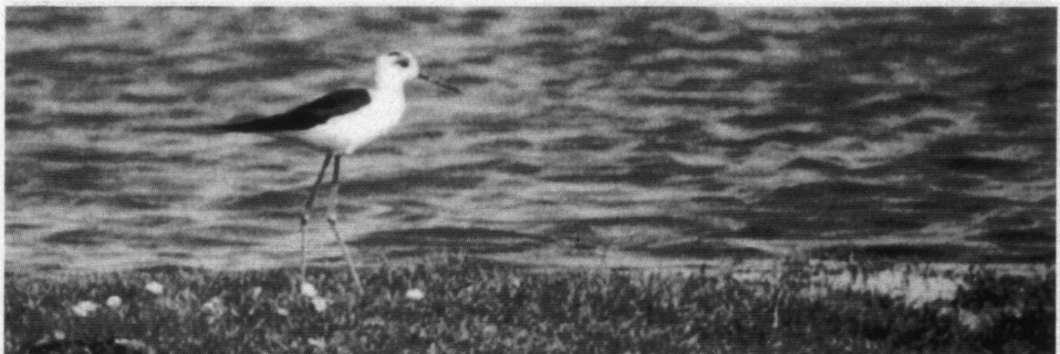
Steltkluut, Groede Z., 27 april 1999.