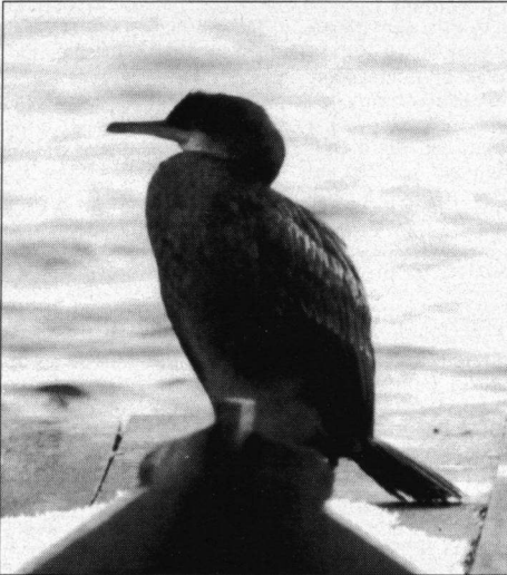
Juveniele Kulfaalscholver, Plas Weijpoort bij Bodegraven Z.-H., 12 juli 1999.