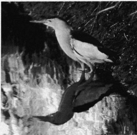
Woudaapje, nabij Petten N.-H., 15 april 1999. Foto: J. van 't Hof.

Kulfaalscholver. 12-7-99 1 juv. ex. Plas Weijpoort nabij Bodegraven Z.-H., zie foto (P.P. Schets).