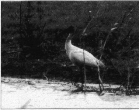
Heilige ibis, Oostvaardersplassen, Lelystad, 20 juli 1999.