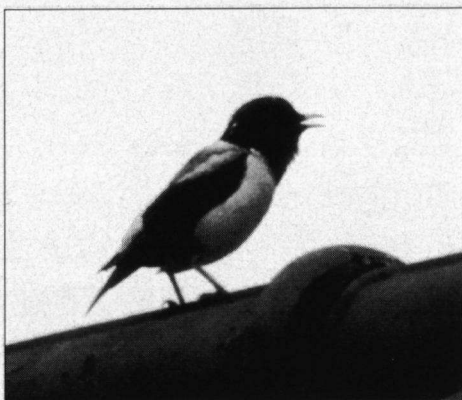
Roze Spreeuw, Weesp, 1 mei 1999.