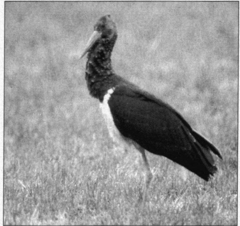
Zwarte Ooievaar nabij Krelleroord, Wieringermeer N.-H., 9 april 1999.

* Purperreiger. 8-5-99 5 ex. Nieuwkoopse Plassen Z.-H. (P. Tak, P. de Droog, T. van Dijk, J. van Blanken); 13-5-99 2 overvl. ex. Kraanlannen, De Veenhoop, gem. Smallerland Fr., 30-6-99 1 ex. De Weerribben O. (P.J. de Boer).