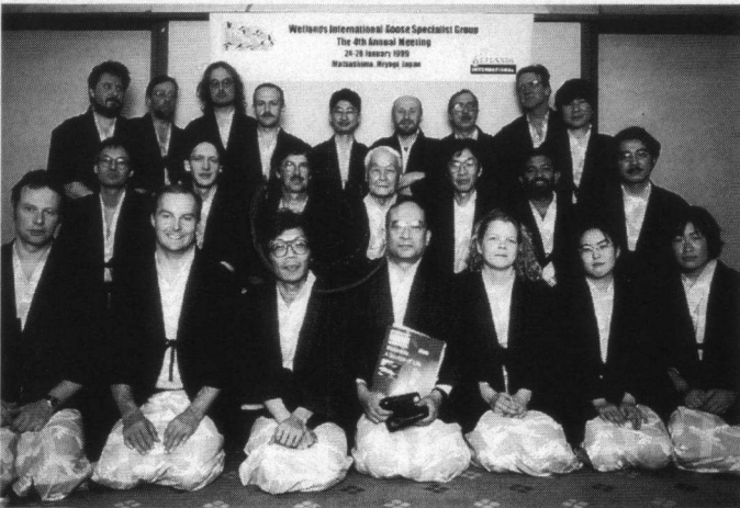
Congresdeelnemers van de Vierde Conferentie van Wetlands International Goose specialist group welke in januari 1999 in Japan werd gehouden.

Alterra (de nieuwe naam die gekozen is na het fuseren van het Instituut voor Bos- en Natuuronderzoek Dienst Landbouwkundig Onderzoek (IBN-DLO) en het Staring Centrum Instituut voor Onderzoek van het Landelijke Gebied (SC-DLO) in Wageningen) houdt de gegevens bij. Er wordt