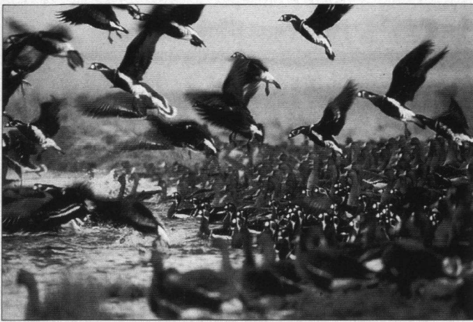
Roodhalsganzen en Kolganzen gefotografeerd tijdens de Derde Conferentie van de Wetlands International Goose specialist group welke in februari 1989 in Bulgarije plaatsvond.

dan moet er worden betaald. Dat lijkt mij niet goed passen bij het vele werk dat vrijwilligers doen ten behoeve van meer inzicht in deze wetenschap.