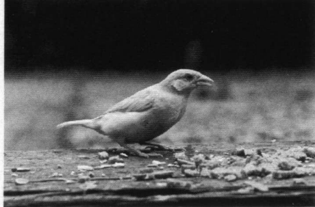
Juvenilele albino Hulmus, Nieuw-Loosdrecht U., 8 juni 1999.

Huismus. 8-6 t/m 25-10-99 1 juv. albino ex. Jhr. van Sypesteynlaan, Nieuw-Loosdrecht U., zie foto (K. Alten).