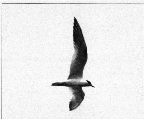
Lachstern bij Haringhuizen (N.-H.) 31 juli 1999.

Lachstern. 31-7-99 1 ex. Haringhuizen N.-H., zie foto