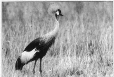
Kroonkranvogel, Hegewiersterfjeld, Kimsward, Harlingen, 27 juli 1999.

Kroonkranvogel. 21-6-99 1 ex. Hegewiersterfjeld, Kimsward, Harlingen, enkele weken op deze plek (Arthur Smeets), 1 ex. SBB-Hogewier, W.-Harlingen, 20-7 t/m 23-7-99 1 ex. Kimsward, Harlingen (E.W.F.