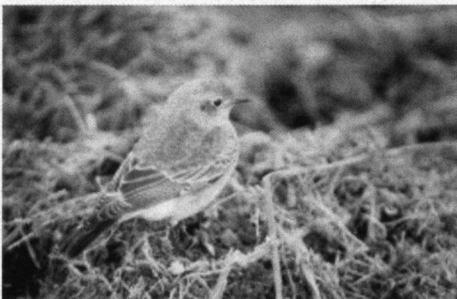
Bonte Tapuit, Nederweert L., 11 november 1999.

Bonte Tapuit. 11-11-99 1 juv. ♀ enkele dagen in droge greppel langs provinciale weg, Nederweert L. zie foto (J. van't Hof, K.J. Eigenhuis).