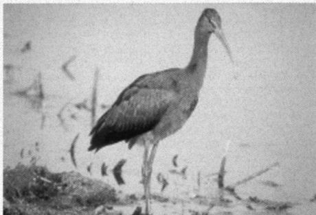
Zwarte Ibis, Petten N.-H., 29 oktober 1999.

Bolsward en Burgwerd Fr., zie ook 10-10-99 (E.W.F. Brandenburg).