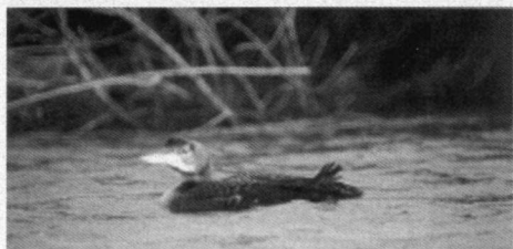
IJsduiker, Tuitjehorn nabij Schagen N.-H., 9 december 1999.

IJsduiker. 9-12-99 1 juv. ex. in sloot, Tuitjehorn, Schagen N.-H., ontdekt door B. Bos. Zie foto (J. van 't Hof, K.J. Eigenhuis).