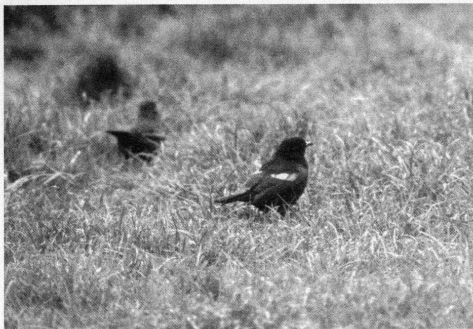
Merelmannetje met aan beide zijden een rij lichtgekleurde grote armvleugeldekken, symmetrisch. Stadhouderslaan bij Bergse Achterplas, Rotterdam-Schiebroek/Hillegersberg, 17 mei 1996.