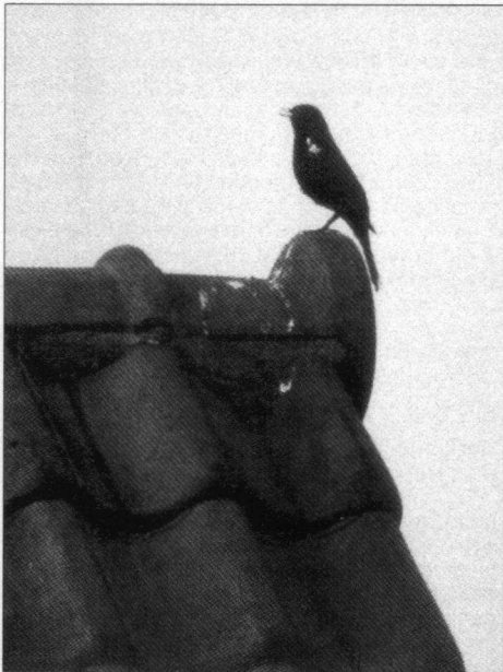
Avondzang van merelmantje (nummer 1 in de tekst), Azaleastraat, Rotterdam-Schiebroek/Hillegersberg, 20 maart 1996.