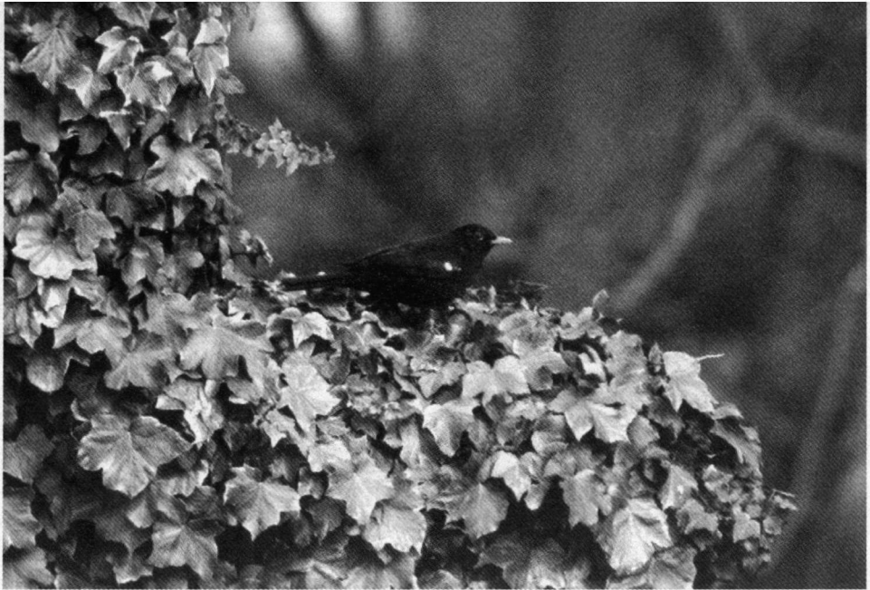
Merelmanneltje (nummer 1) in klimop, Azaleastraat, Rotterdam-Schiebroek/ Hillegersberg, 30 maart 1996.