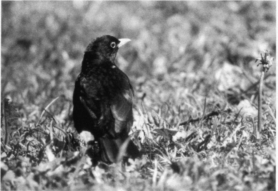
Merelmanneltje met een wit veertje, genoeg voor herkenning. Melanchtonpark, Rotterdam-Schiebroek/Hillegersberg, mei 1997.

vogel had ingenomen, bleek op zijn beurt op 25 mei het veld te hebben geruimd. Een mooi zwart merelmanneltje met diepgele snavel zong vanuit het topje van de Prunus.