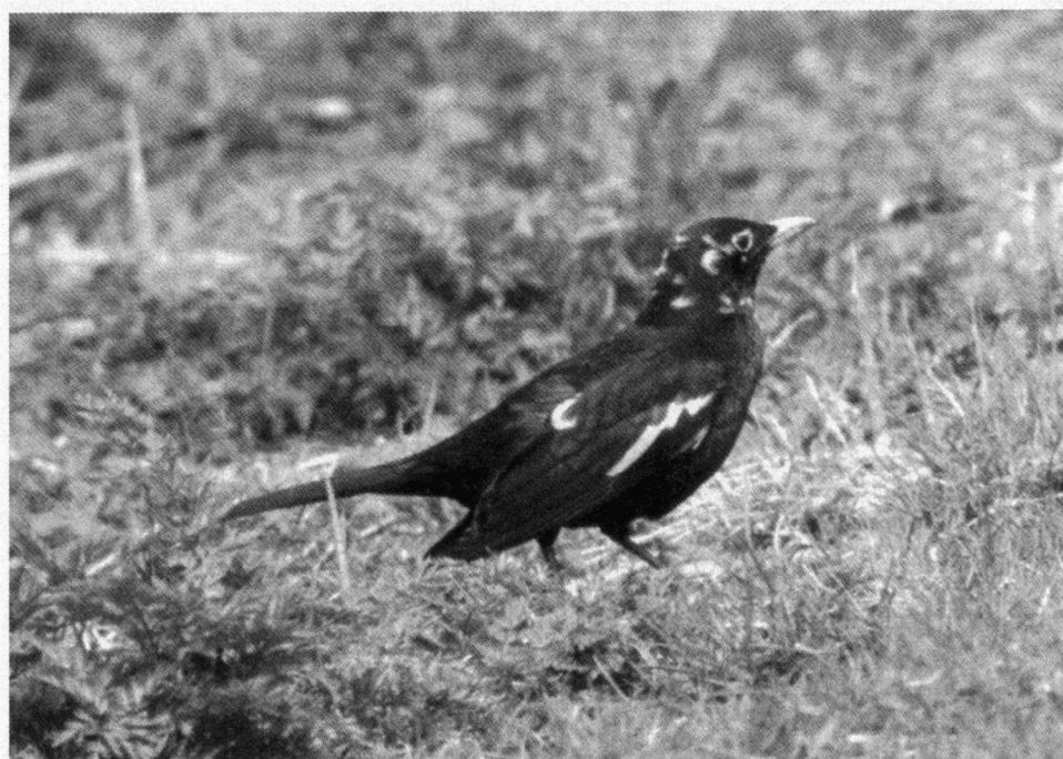
Bonte merelman, Koornmolengat, Zevenhuizen (Z.-H.), 6 mei 1996.