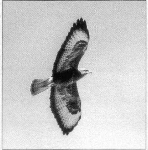
In maart 1998 zagen wij per dag vele duizenden Steppenbulzerden.

Een andere kibboets in de Negev is Sede Boqer, die ons meer opleverde dan Yotvata. Onderweg zagen wij regelmatig broedvogels als Woestijnvink,