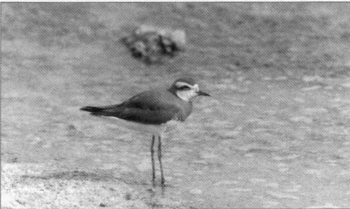
De Kaspische Plevier is een zeldzame doortrekker in Israël.