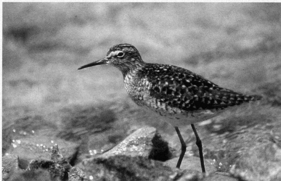
Aan de oevers van de zoutpannen foerageert de Bosruiter.

Witkoptapuit en de Bruinnekraaf. In de kibboets tientallen Bijeneters op de telefoonleidingen en Vale Gieren en Aasgieren (die regelmatig worden bijgevoerd, in het kader van een gierenproject). Ook de tuinen rondom de 'Ben Gurion begraafplaats' werkten als een magneet voor de trekkers, wij zagen hier tientallen Draaihalzen op de grasveldjes en verder vele zangers als Roodborstjes en Roodborsttapuiten. Iets verderop in het Nahal Zin, een fantastisch canyonachtig woestijnlandschap met goede wandelmogelijkheden, weer Aasgieren, Rotsduiven en vele Aziatische Steenpatrijzen.