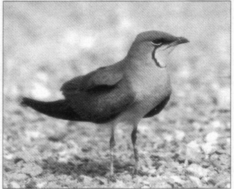
Vlak bij het waterreservoir in de buurt van Ellat troffen wij een paar dagen lang foeragerende Vorkstaartplevieren aan.