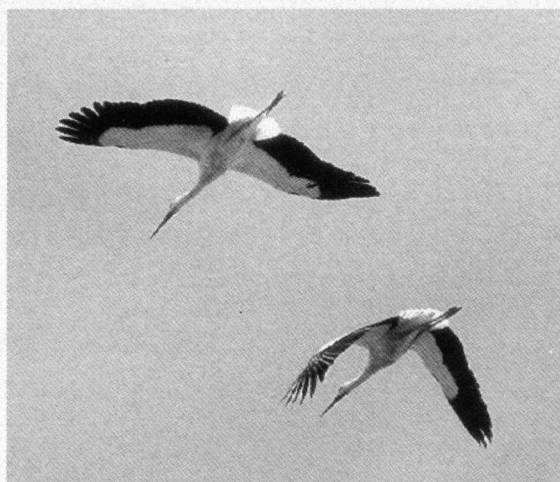
In noorden van Eilat schreeven Ooievaars in thermiekbellen omhoog om in lange glijvluchten te verdwijnen over de bergpassen.

Witkoptapuit en de Bruinnekraaf. In de kibboets tientallen Bijeneters op de telefoonleidingen en Vale Gieren en Aasgieren (die regelmatig worden bijgevoerd, in het kader van een gierenproject). Ook de tuinen rondom de 'Ben Gurion begraafplaats' werkten als een magneet voor de trekkers, wij zagen hier tientallen Draaihalzen op de grasveldjes en verder vele zangers als Roodborstjes en Roodborsttapuiten. Iets verderop in het Nahal Zin, een fantastisch canyonachtig woestijnlandschap met goede wandelmogelijkheden, weer Aasgieren, Rotsduiven en vele Aziatische Steenpatrijzen.