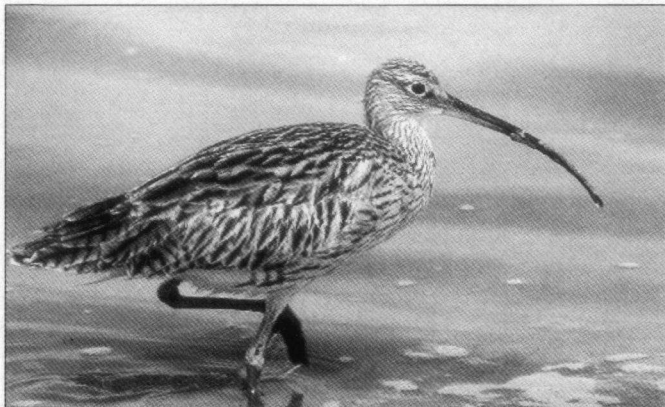
Vlak bij het waterrreservoir troffen wij ook Wulpen aan.

N.B.: Het 'International Birdwatching Center Eilat' in Eilat kan behulpzaam zijn bij het organiseren van excursies (wij hebben er zelf geen ervaring mee), de verkoop van boeken en het verstrekken van recente trekinformatie