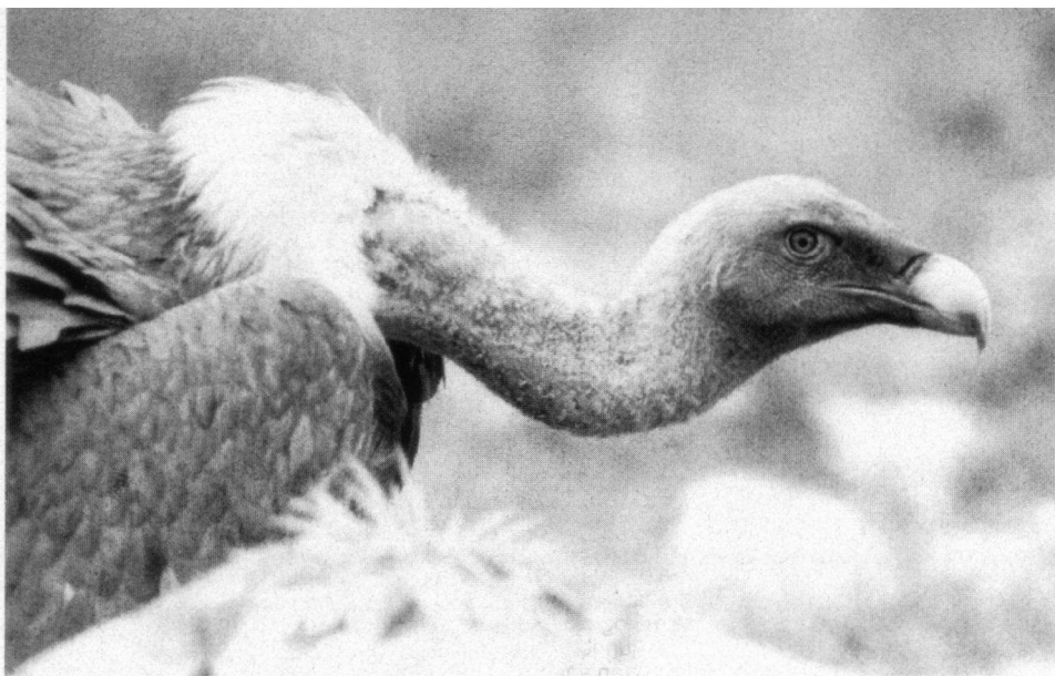
Tot nu toe zijn er al 120 Vale Gieren dood gevonden, waarvan het grootste aantal in de Sierra de Ronda.