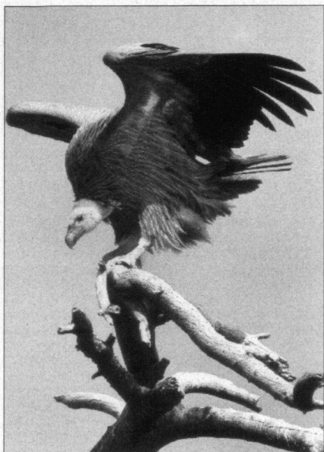
Het programma Antidoto wil de stootvogels in Spanje beter beschermen.