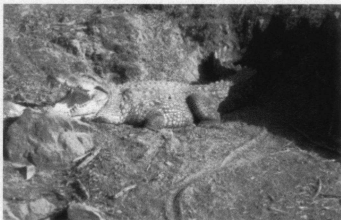
Moeraskrokodil is een paradepaardje van Ranthambore.

In Ranthambore zijn ook enkele beekjes. Het is heerlijk om na een rit door de droge hitte in het open gebied in het weelderige groene bos te komen. Het is er vochtig en groen. In de bomen zien wij een paar Maleise Wespeneieren. Het hele vliegbeeld lijkt sterk op dat van onze Wespeneier,