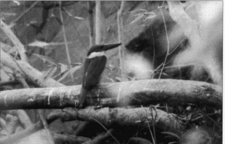
De Ooievaarsbekijsvogel is een vaste luidruchtige bewoner van de beken in Ranthambore.

Dwergooruil (vaak in grote Wurgvijgen), Rode Tortel, Parelhals- en Palmtortel, Indische Bonte Specht, Bruinkopspecht en Geeloorsspecht en nog veel meer.