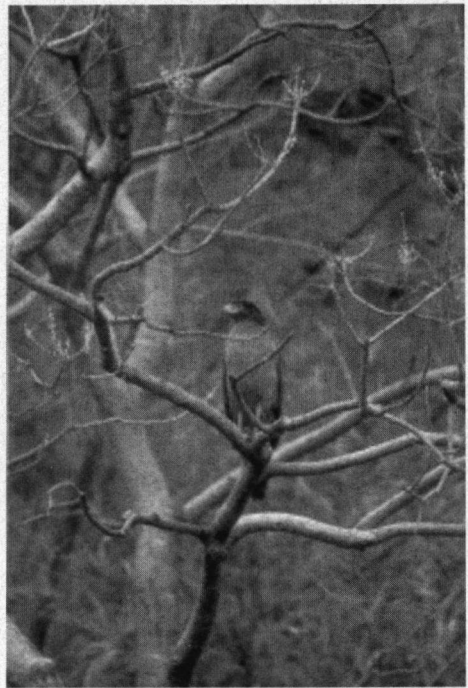
De Indische Slangenarend kom je zowel in open terrein als in bos tegen.

Ranthambore lijkt in een aantal opzichten veel op Bandhavgarh, maar er zijn verschillen. Grote delen van het park zijn in april kurkdroog met blader-