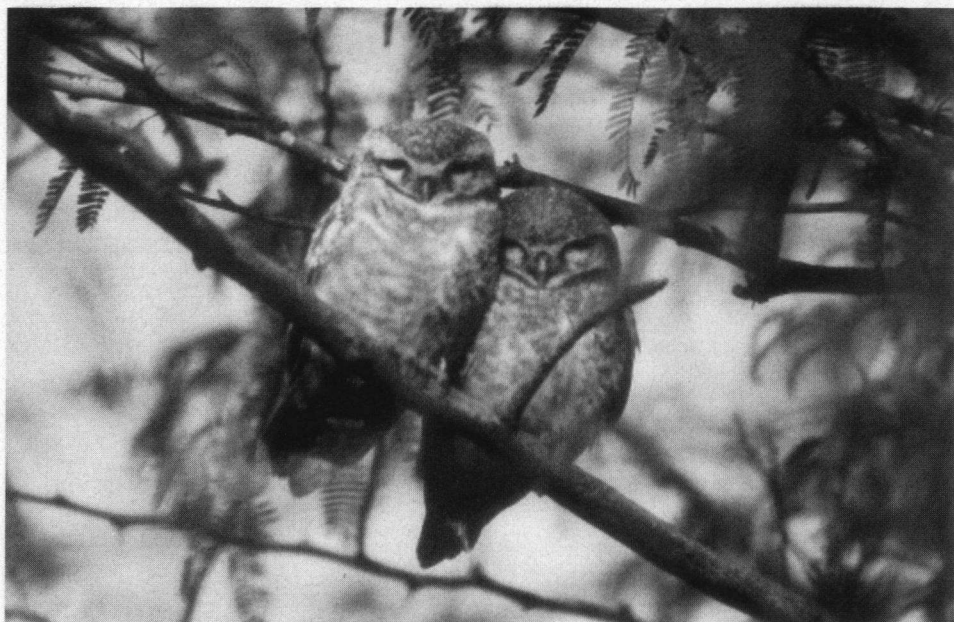
De Bruine Vlsuil broedt vlak bij poelen en beken in Bandhavgarh.