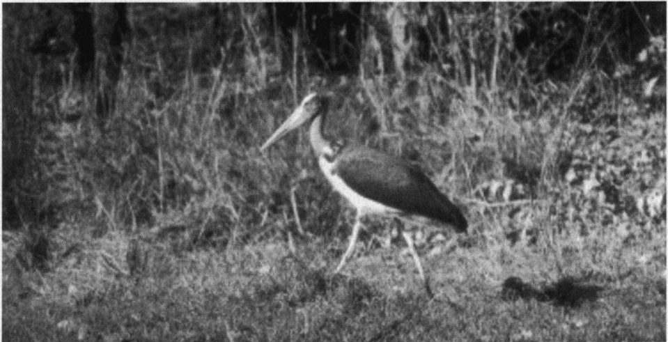
De Javaanse Maraboe kom je als solitair individu regelmatig tegen in Bandhavgarh.

loze bomen. De kleuren okergeel en bruin overheersen, behalve bij de boom die men daar de 'Flame-of-the-Forest' ( Butea monosperma ) noemt; een vlinderbloemige met prachtig orangerode bloemen en groene peulen. Er zit geen blad aan deze bomen in april maar de overvloedige trossen bloemen compenseren dat ruimschoots. In het dorre landschap zijn groepen van bomen een lust voor het oog. De Gewone Hoelma, de Halsbandparkiet, de Grote Alexanderparkiet en veel andere