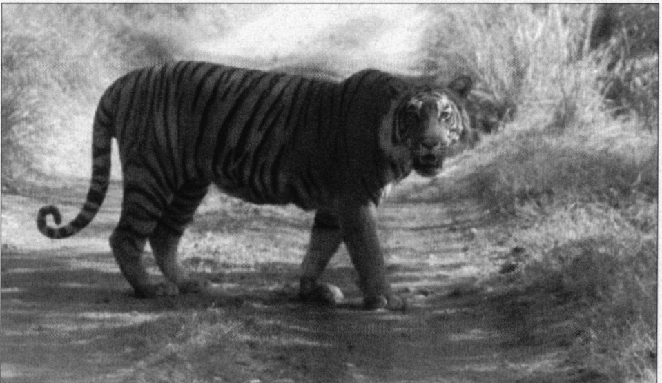
Elke ontmoeting met een tijger is een hoogtepunt.

Tijdens het rondrijden of afwachten op plekken waar onze gidsen iets bijzonders verwachten (Tij-