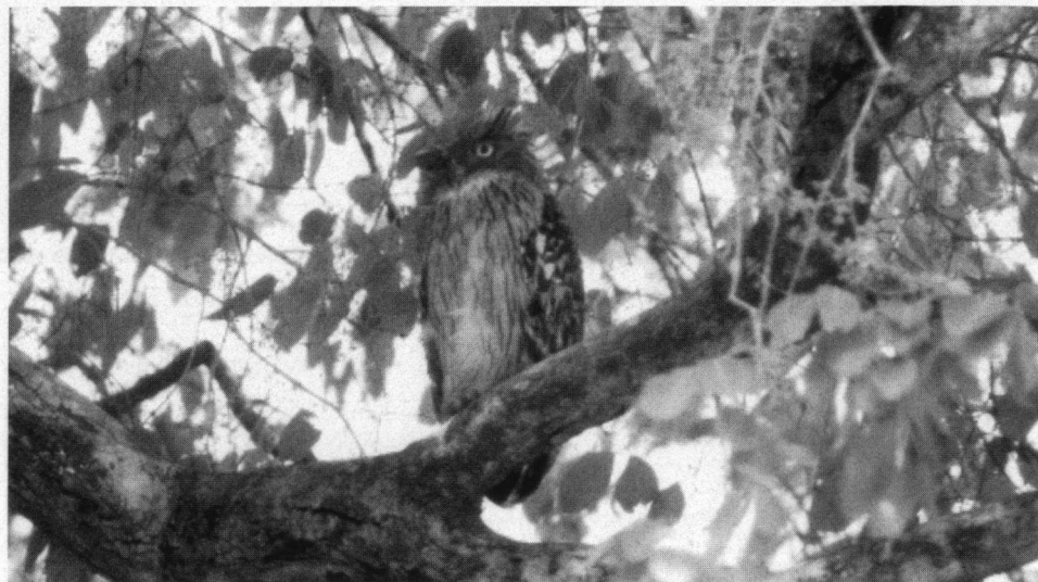
Brahmaanse Steenuilen, hier twee jongen, vind je overal. Ze laten zich gemakkelijk zien.