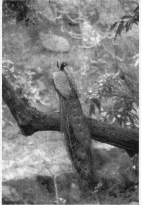
De Blaauwe Pauw is zeer algemeen in de tijgerreservaten maar vooral opvallend in Ranthambore.

Wat erg opvalt in Ranthambore zijn de grote aantallen Pauwen die je vooral ziet bij binnenkomst van het park. Soms zijn er wel vier of vijf mannetjes tegelijk bezig met pronken, met quasi ongeïnteresseerde vrouwtjes eromheen. Bij het rijden over de onverharde wegen komen wij voortdurend Grijs Frankolijnen tegen die langs de paden scharrelen en soms verschrikt wegvliegen. Af en toe komen we Bankivahoenders tegen, een enkele keer een prachtige diepgroene Smaragdduif. Een trouwe bewoner van alle parken en alle biotopen van nat tot kurkdroog is de Smyrna ijsvogel. Er is in Ranthambore meer gesloten bos dan in Bandhavgarh. Het is er rijk aan zoogdieren; vooral Nijlgau, Axishert en Sambar en soms ook de Indische Gazelle ( Gazella gazelle ) en met geluk een Tijger. Vogels die wij er zien, zijn Grijs Frankolijn, Parelwergfazant, Grote Alexanderparkiet naast de al bekende Halsband- ( Psittacula krameri ) en Pruimekopparkieten, Indische Malkoha, Indische