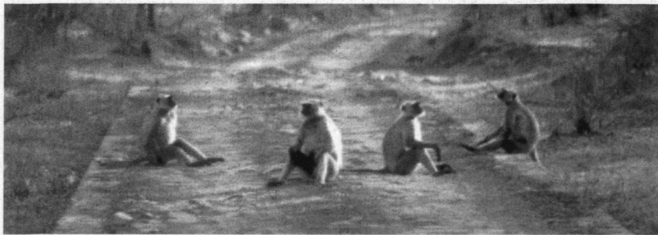
Gewone Hoelmaan is een apensoort die je meer in het bos dan bij de mensen tegenkomt, dit in tegenstelling tot de Rhesusaap.

ger, Panter - Panthera pardus of Lippenbeer - Melursus ursinus ) zien wij veel dieren. Het Axishart is zeer algemeen, evenals de Sambar of Paardhert ( Cervus unicolor ) en de Gewone Hoelmaan ( Semnopithecus entellus ). Af en toe zien wij een Jakhals ( Canis aureus ), Indische Mangoeste ( Herpestes edwardsi ), Wilde Zwijn ( Sus scrofa ), Rhesusaap ( Macaca mulatta ) of Palmeeekhoorn ( Funambulus pennanti ). De kans op een Panter is minimaal; die mijden gebieden waar de Tijger algemeen is. De Lippenbeer is in deze tijd van het jaar alleen in de nacht actief.