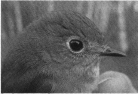
Detail van geringde Blauwstaart.

Foto's van de vangplaats en natuurlijk van diverse vangsten zijn te bewonderen. Met enige tranen in de ogen geniet ik van de foto's van de Blauwstaart ( Tarsiger cyanurus ) die aan mijn soortenlijst nog steeds ontbreekt. Die week was ik op Vlieland en ik wist niet dat wij (de Blauwstaart en ik) er samen waren.