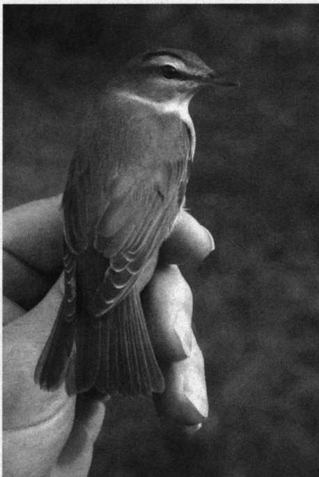
Eerste kalenderjaars Roodoogvireo, geringd op Schiermonnikoog op 13 oktober 2001.

Dezelfde opzet als bij de site over Schier, wordt ook hier gevolgd. Er zijn dus recente meldingen. Ook terugmeldingen worden genoemd en dat is altijd smullen. Niet alleen worden terugmeldingen