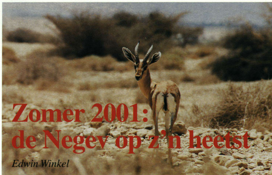
Arabische Gazelle.

Israël is één van de belangrijkste en drukste vogelknooppunten ter wereld en de vele vliegbewegingen trekken in het voor- en najaar evenzoveel vogelaars. Ik bezocht het land in juni 2001. Hoofddoel van mijn reis was de observatie van aanwezige kraaiachtigen. Deze standvogels zijn er altijd. Weer of geen weer, jongen of geen jongen. Dat laatste was misschien wel het grootste voordeel van mijn midzomerbezoek. Vrijwel alle vogels, inclusief kraaien en raven, waren druk in de weer met hun kroost. Zelfs rond het bloedhete middaguur sperden de kids hun rode bekkies luid en wijd open voor het aangevoerde voedsel. Er hing deze zomer een serene sfeer in de Negev. Geen vogelaars, omdat er geen trekbewegingen waren. Geen toeristen, vanwege alle aanslagen. Een beetje bizar, maar er zijn slechtere omstandigheden denkbaar voor een vogelreis. De trip begon in Eilat.