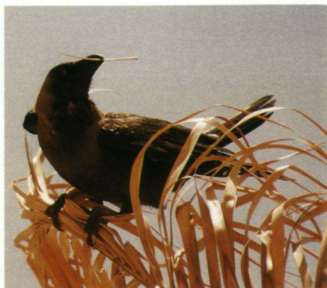
Een geïrriteerde Huiskraai maakt duidelijk wiens territorium dit is.

Eilat bezocht ik speciaal voor de Huiskraai ( Corvus splendens ). Dat leverde geen teleurstelling op. Integendeel, het dier leverde mij een schat aan nieuwe inzichten op. Ik had ondermeer verwacht dat de Huiskraai veel meer een groepsvogel was dan uiteindelijk bleek. In kleine stadsparken duldten paartjes een naburig stel in een paar palmen of tamariskens verderop, maar over het algemeen heeft ieder koppel z'n eigen ruim afgeperkte territorium. Alle delen van Eilat die ik bezocht, bleken zo te zijn verdeeld. In die afgebakende gebiedjes waren buitenstaanders niet gewenst. Als ik in de buurt van het nest of van inmiddels volgroeide jongen kwam, werd er door de ouders furieus gereageerd. Hevig krijsend probeerden ze me dan met duikvluchten uit hun gebiedje te verdrijven. Als dat niet snel genoeg ging, richtten ze hun agressie op de takken en bladeren, om die vervolgens met veel machtsvertoon af te breken of te verwijderen. In het uiterste geval schoten de burens te hulp. En dan staakte ik snel mijn observatie. Hun gezamenlijke kabaal viel dan op z'n zachtst gezegd een beetje op. Eén keer wilde ik per se volharden in mijn opdracht. Bij de kunstmatig aangelegde lagune in oostelijk Eilat vond ik een dode Huiskraai. Het gedrag dat mijn vondst vervolgens bij de Huiskraaien losmaakte