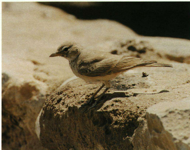
Een Woestijnleeuwerik op wacht bij de vesting Massada.

hun limiet. Eén voor één vliegen ze naar het noorden richting het natuurreservaat Hai Bar, waar ze tijdelijk uit het zicht verdwijnen.