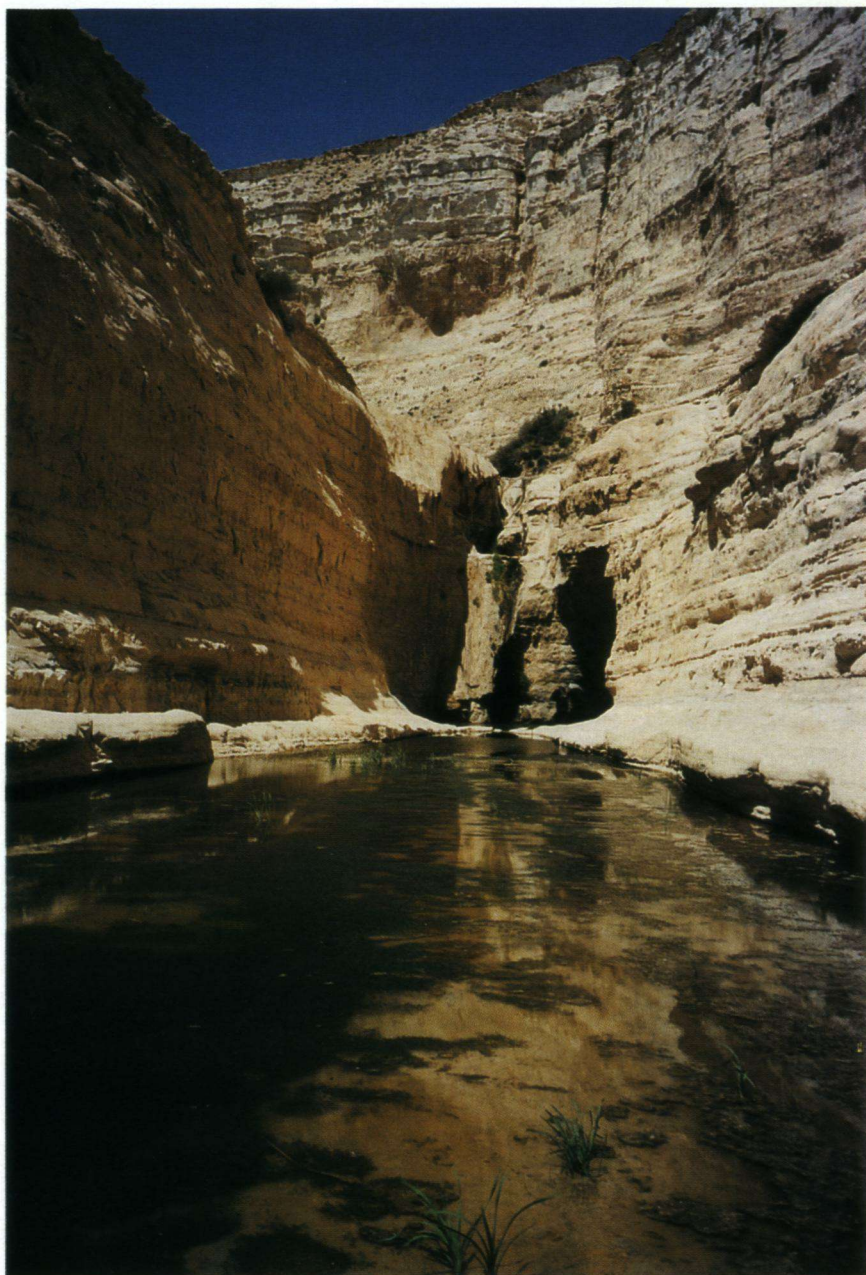
Ein Avdat: een oase in de woestijn!