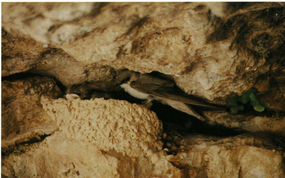
Vale Rotszwaluw met kroost.

Boven Hai Bar zag ik een gezinnetje van zes hoogte maken op de thermiek tot ze letterlijk uit het zicht verdwenen. In de Mizpe Ramon-krater stunte een paartje, zoals alleen raven dat kunnen. Accelereren, duiken, wentelen, keren en elkaar de klauw schudden tijdens een adembenevende vrije val. Dode dieren op straat of in de woestijn waren altijd raak. In de buurt zat dan een raaf op een hek, in een boom of mast of in de lucht, maar zelden op de grond. De Bruinnekraaf verkiest het desolate, het kale en een overzichtelijk territorium. Eén keer heb ik in Ein Gedi een exemplaar gezien dat mee zweefde met een grote groep Waaiertaart-raven ( Corvus rhipidurus stanleyi ). Dit brengt mij op de discussabele aanwezigheid van de noordelijke Raaf aan de Dode Zee. Veel