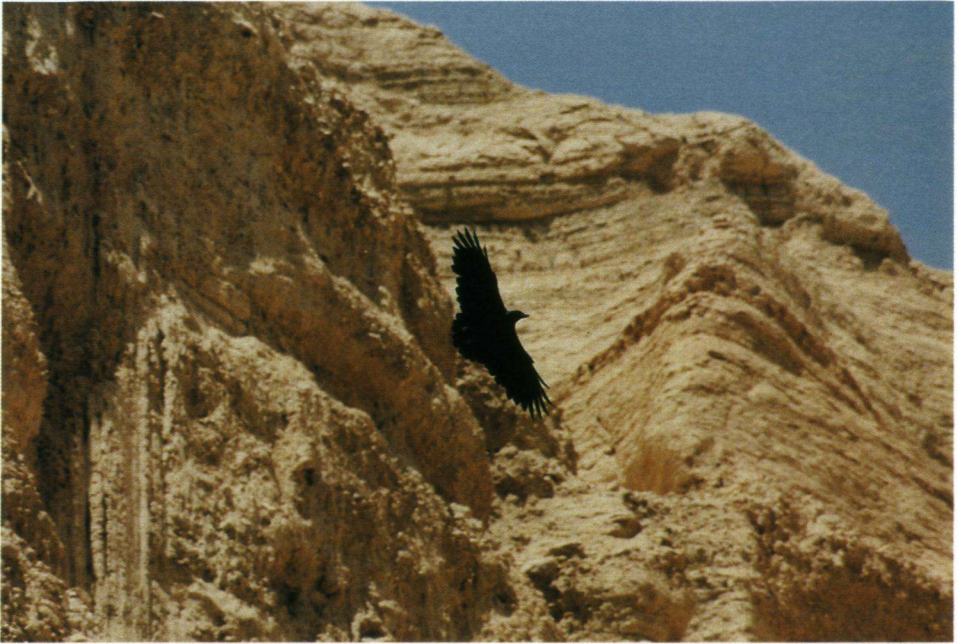
Klassiek vliegbeeld van de Waaiersaartraaf.