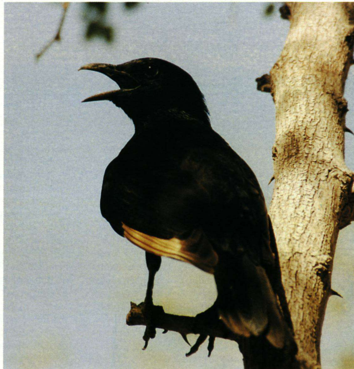
Een Tristram Spreeuw blaast even stoom af.

De kop van de Waaiersaartraaf met zijn dikke gedrongen snavel en het spelevaren op de warme luchtstroom zijn enkele kenmerken die typisch voor de raaf zijn. De permanente groepsvorming, de ijle kraaiachtige roep en het relatief tamme gedrag zijn dit in ieder geval niet. De verspreiding van de Waaiersaartraaf lijkt zich hoofdzakelijk te beperken tot het Dode-Zeegebied - en dan met name rond Ein Gedi - en wellicht wat geïsoleerde plekken in de Arava-vallei. Dat is merkwaardig, omdat er in het zuiden van Israël nog wel een aantal plekken is die overeenkomen met de biotopen van de Nahal-parken, bijvoorbeeld de kloof van Ein Avdat. Ook