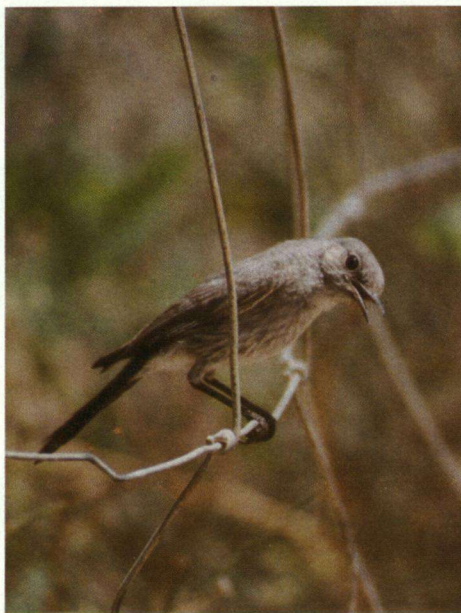
De Zwartstaart is over het algemeen zeer fotogeniek.

Kibboets Sede Boqer en de rondom liggende plantages zijn in dit gebied ook zeker meer dan een kijkje waard. Ik zag er Groenlingen ( Chloris chloris ), Merels ( Turdus merula ) (veel zuidelijker gaat bijna niet), Palestijnse Honingzuigers ( Nectarinia osea ) (pa, ma en kroost), Zomertortels ( Streptopelia turtur arenicola ), Boerenzwaluwen ( Hirundo rustica ), een Boomvalk ( Falco subbuteo ),