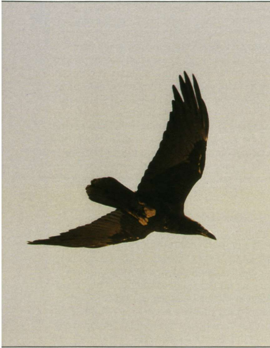
De majestueuze Bruinnekraaf.

daar vormt een zoetwaterstroom de levensader en bevinden cultuurgronden met eetbare gewassen zich op vliegafstand. Groot verschil tussen Ein Gedi en Ein Avdat is de grote concentratie aan roofvogels. Ein Avdat wordt bewoond door een paartje Havikarenden ( Hieraetus fasciatus ), vier Aasgieren en circa vijftig Vale Gieren ( Gyps fulvus ). De Woestijnvalk ( Falco concolor ) en de Steenarend ( Aquila chrysaetos ) zijn daarnaast gelegenheidsbezoekers. Gek genoeg trof ik in drie dagen tijd maar twee roofvogels (Aasgieren) aan in Ein Gedi. Uitgerekend in Nahal Arugot, waar maar enkele paren Waaiersaartraaf vertoefden.