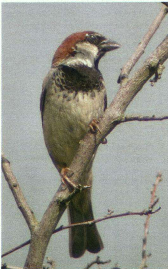
Opvallende Huismus.

Op 1 juli 2003 was er in Zoetermeer een Huismus die de aandacht trok van Adri de Groot. Hij maakte enkele foto's van deze vogel en plaatste deze op een van de vogeldagboek-pagina's op het internet ( http://www.vogeldagboek.nl ). Na publicatie van de foto's werd een reactie ontvangen van iemand die opmerkte dat het wel een Italiaanse Mus leek. Opvallend waren de (helderrode) kleuren. Het begin van de kruin van deze