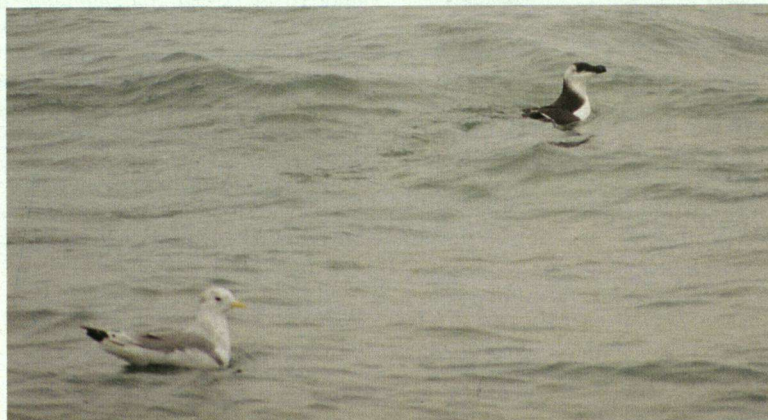
Alk Drieteenmeeuw.