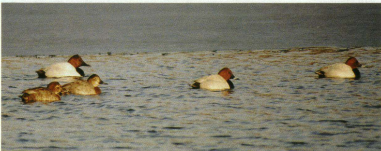
Grote Tafeleend.

22-02-03 1 Noord-Hollands Duinreservaat, Bakkum-Noord, Castricum. R. Costers. Foeragerend in ijsvrije, snelstromende duinbeek.