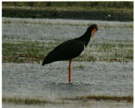
Zwarte Ooievaar, De Hamert Noord-Limburg, 4 juli 2003.