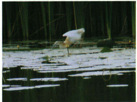
Ralreiger, Alblasserdam, 9 juli 2003.