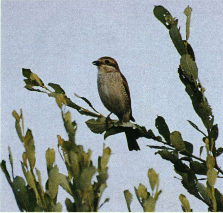
Grauwe Klauwier, Vroome Veld Drenthe, 10 juli 2003.