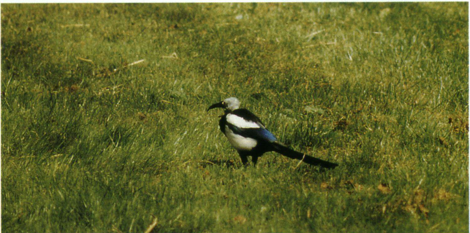
Een Ekster in het gras bij het Veluwemeer met een wel heel merkwaardige snavel.

Een vriend vertelde mij eens dat hij in de tuin emmers had staan waarin hij planten had vervoerd. De planten had hij eruit gehaald, maar daarna was er nog een flinke laag modder (kleiachtig materiaal) in de emmers was achtergebleven. Tot zijn verbazing, hij is geen vogelaar, zag hij regelmatig één en soms twee Eksters op de rand van de emmers zitten. Zij pikten in de klei en vlogen daarna met een snavel vol weg. De snavelafdrukken waren in de klei te zien. Ik concludeerde dat zij de klei als