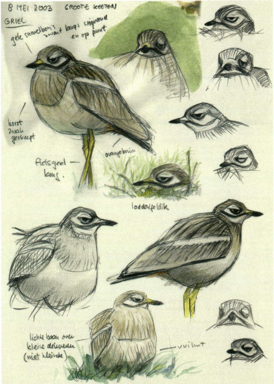
Griel Burhinus oedichnemus , 8 mei 2003, Groote Keeten, Noord-Holland. Ontdekt door Henk Bouma. Dichtsbijzinde broedgedied: Noord-Frankrijk.