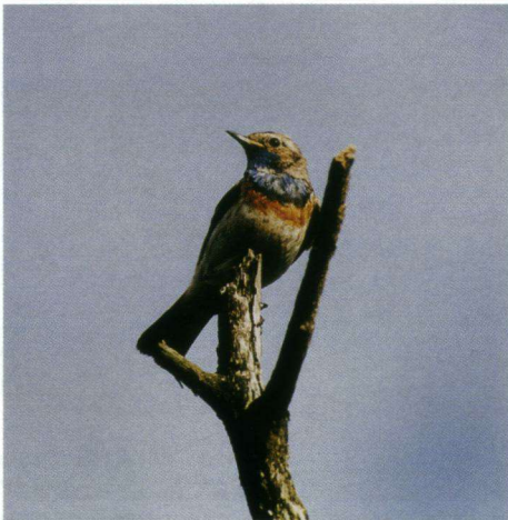
Blauwborst, Fochteloërveen, 11 juni 2003.