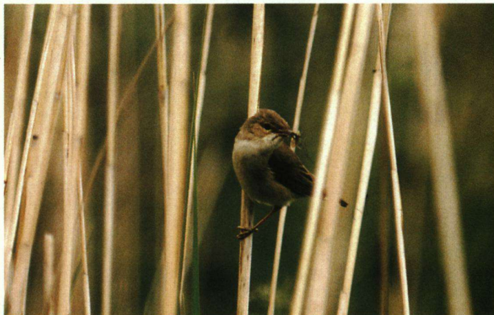
Een uitgebreide inventarisatie van het vogelleven in 1976 leverde onder andere 42 paren van de Kleine Karekiet op.

Het beheer van een aantal percelen wordt sinds enkele jaren geleden uitgevoerd door de natuurgroep en de stichting. Vorig jaar is een groot perceel, waar vroeger met name de Roerdomp broedde, ontdaan van houtopslag. Het verruigde Riet is verwijderd en de tussenslootjes zijn weer opengegraven. De aanzienlijke kosten zijn gedeeltelijk betaald uit een subsidie van de provincie Utrecht en Fortis Foundation. Daarnaast heeft het plaatselijke zangkoor Ezidako een