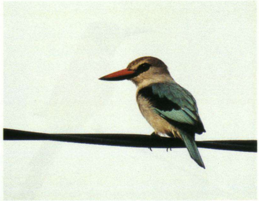
Senegalijsvogels Halcyon senegalensis zijn onmiskenbaar! Zij komen vooral voor in droog en open terrein.

Benin is een land in West-Afrika waar nog nauwelijks systematisch vogelonderzoek heeft plaatsgevonden. Sovon heeft een paar jaar geleden de kust geïnventariseerd. In het binnenland en in het noorden valt nog veel te ontdekken. Benin is een aantrekkelijk