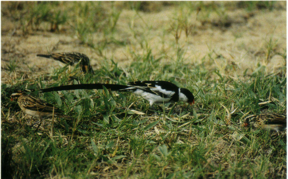
De Dominicanerwida Vidua macroura is heel algemeen in droge savannen en in gecultiveerd land.

Maclean G.L. (1993): Roberts's Birds of Southern Africa, 6e editie. uitg. Trustees of J. Volcker, birdbookfund. Kaapstad.