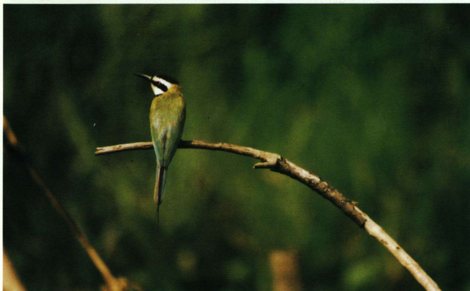
Witkeelbijeneters Merops albicollis jagen vanaf een takje op één à twee meter van de grond. Het zijn algemeen voorkomende vogels in Benin.