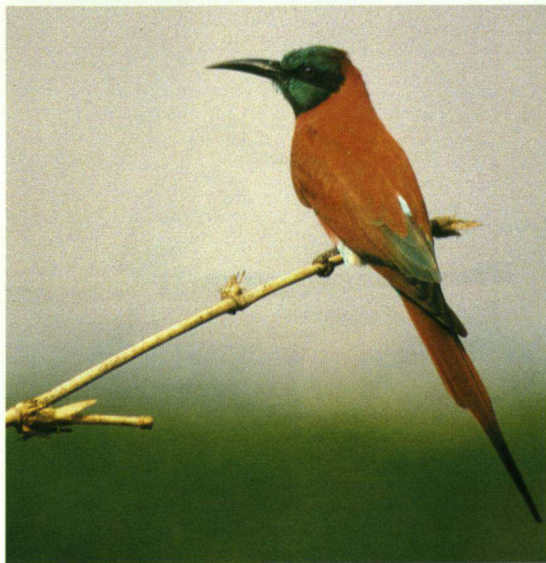
De Karmijnrode Bijeneter Merops nubicus foerageert graag in weldegebieden met rietstengels en laat zich heel gemakkelijk benaderen.

phaeopus , Grutto Limosa limosa , Rosse Grutto Limosa lapponica , Oeverloper Actitis hypoleucos , Bosruiter Tringa glareola , Tureluur Tringa totanus , Groenpootruiter Tringa nebularia , Drieteenstrandloper Calidris alba , Bonte Strandloper Calidris alpina , Temmincks Strandloper Calidris temminckii , Zilverplevier Pluvialis squatarola en de Bontbekplevier Charadrius hiaticula .