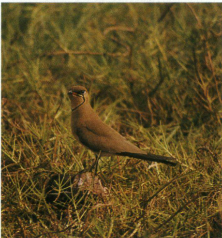
Een Vorkstaartplevier Glareola pratincola zit op kleine polletjes in een grasgebied en jaagt daar op de grond naar insecten.

Een tochtje naar de moerassen in de buurt van Guézin gaf een aantal Palearctische steltlopers, zoals Regenwulp Numenius