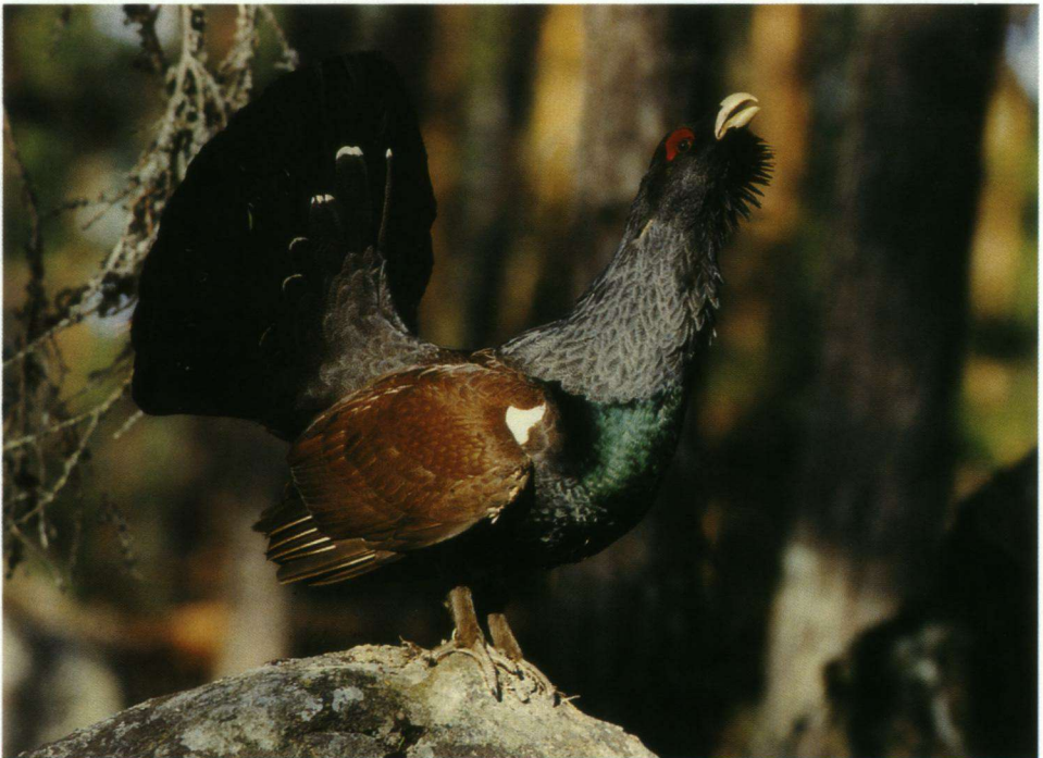
Een auerhaan met borst groen iriserend, buik zwart, de kop met een grote rode vlek boven elk oog en een forse brede geopende snavel.

De volgende ochtend, rond over vijven, is het wederom koud, maar bewolkt. Terwijl wij bij de auto nog even bezig zijn onze wandelschoenen aan te trekken, valt er met fladderend geraas een auerhaan neer op de weg. Hij komt uit een boom aan de andere kant van de weg: het is dezelfde haan!. Met opgestreken vleugels komt hij weer op ons af en valt opnieuw aan. Ik buig mij voorover en probeer ook zijn imponeerhouding aan te nemen, maar, dat maakt geen enkele indruk. Zonder aarzeling valt hij mij kordaat aan. Doordat ik gauw mijn schoen opsteek om hem tegen te houden, deelt hij met zijn rechtervleugel in de gauwigheid een klap uit die klinkt als een klok. Mijn vrouw vindt intussen achter de tent een dennentak en geeft die aan mij. 'Dan kun je hem van je afhouden', zegt ze erbij en ze loopt alvast de bosweg op. Op zo'n vijftientwintig meter van de auto blijft de haan staan. Ik loop daar zelf een stukje vanaf en op nog geen vijftig