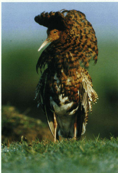
Kemphaan in broedkleed.

volle broedgeval van deze soort in Nederland sedert de 16de eeuw (zie foto in Dutch Birding 23, 4: 242, Natuurbehoud augustus 2001 pagina 91). De Nooyers werk is in velerlei vorm gepubliceerd, zoals in tal van natuurkalenders en natuuragenda's (waaronder die van Natuurmonumenten en het Vogeljaar) en in de meeste landelijke natuurbladen, zoals Natuurbehoud, Grasduinen, Vogels en het Waddenbulletin. Ook vertoonde hij zijn foto's op vele lezingen en exposities of als vaste tentoonstelling van natuurbezoekerscentra. Zijn fotoarchief zal worden opgenomen in de collectie van het natuurfotobureau Foto Natura te Wormerveer.