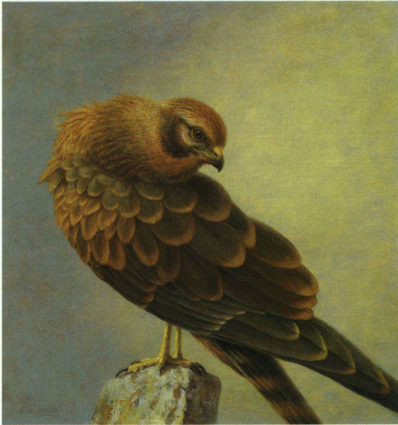
Een juveniele Grauwe Kiekendief.