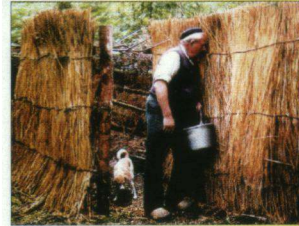
Eendenkooi Stichting www.eendenkooi.net

De passie en inzet van de kooiker voor zijn eendenkooi is er echter niet minder op geworden.