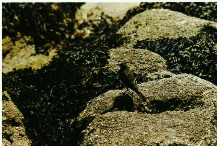
Oeverpieper op kustrotsen met wier, 16 juli 2003, Île Tudy, Bretagne, Frankrijk.

Geconcentreerd en systematisch werden de veelbelovende plekken aan de verschillende gevels afgewerkt, waar mogelijk liep de Oeverpieper over een stoep, een vensterbank of een zonnescherm. Soms kort fladderend