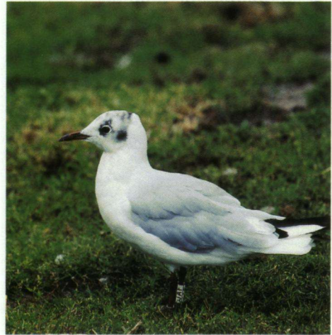
Kokmeeuw bij Klinkenbeltskolk, Deventer 4 augustus 2004. Deze vogel is geringd in Denemarken.