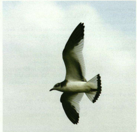
Vorkstaartmeeuw met lichte kop, Eemshaven-Oost, 27 september 2004.

14-06-04 1 Groote Wije, Botshol, Vinkeveen. G. Hiemstra. Mannetje.