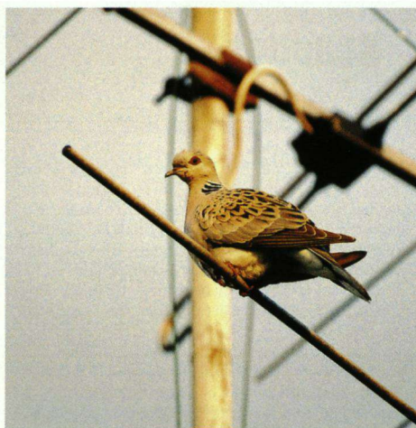
Zomertortel, Hoge Hexel, 20 juni 2004.