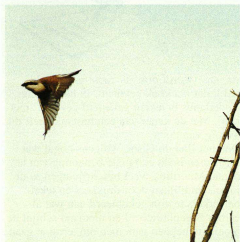
Mannetje Grauwe Klauwier, Schoonheten, 28 juni 2004.