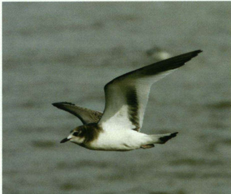
Vorkstaartmeeuw met donkere kop, Eemshaven-Oost, 27 september 2004.