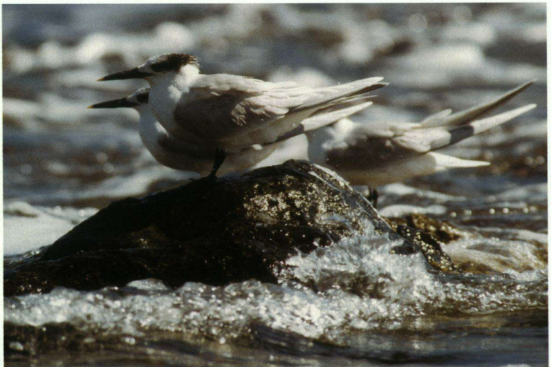
Grote Sterns.