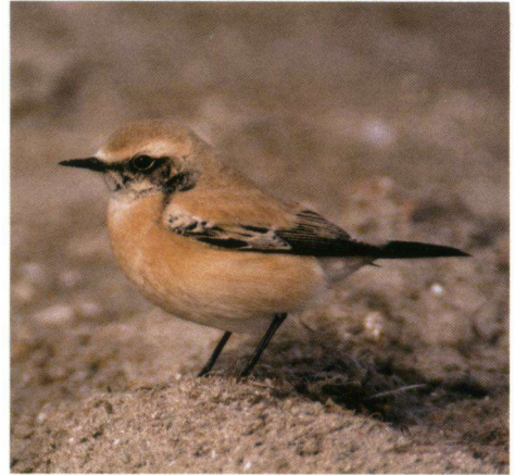
Woestijntapuit, Zuidpier, IJmuiden, 28 september 2005.