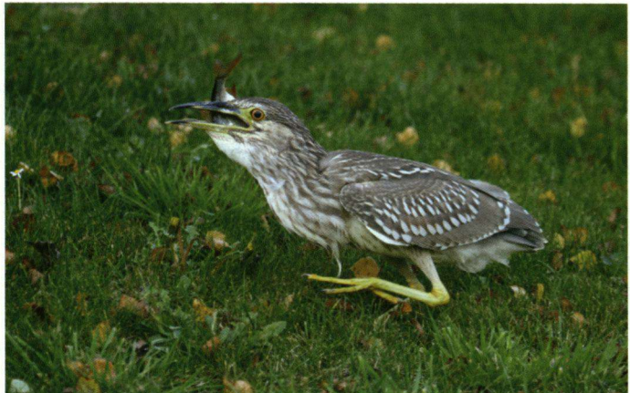
Kwak, Noorden, Mijdrecht, 27 oktober 2005. Foto: E. Winkel.

02-08-05 50 Slotterplas, Amsterdam-West. J.R. Odink.