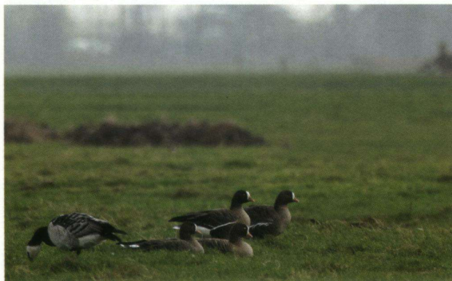
Dwergganzen, De Kolken, Anjum, 8 november 2005.