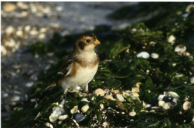
Sneuwgors, Kwelder van Wierum, 8 november 2005.