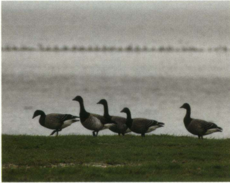
Witbuikrotganzen, Kwelder van Wierum, 8 november 2005.