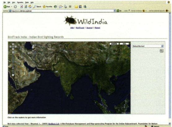
Voorbeeld van een pagina over de Indiase natuur.

De kauwensite die ik in een vorige aflevering noemde, geeft op dit