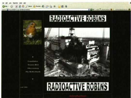
Over radioactiviteit bij vogels is niet veel gepubliceerd. Op internet is daarover wel wat informatie te vinden.

Wie een boek zoekt kan dat doen via: http://www.abebooks.com . Mogelijke alternatieven zijn: http://www.addall.com of www.bookfinder.com . Natuurlijk valt er ook op dit gebied van alles te