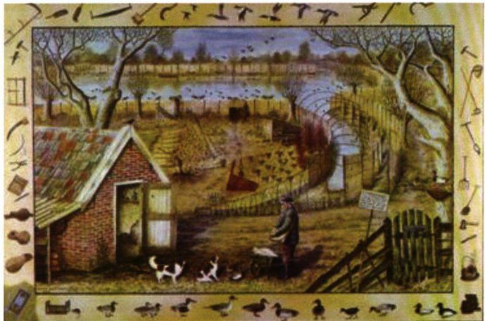
Een oude eendenkooi in bedrijf.