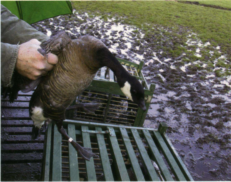
Een zojuist gevingde Canadese Gans krijgt zijn vrijheid weer terug. Het vangen van wilde ganzen is tegenwoordig alleen nog maar toegestaan ten behoeve van wetenschappelijk onderzoek. Voor het vangen wordt gebruikgemaakt van slagnetten. De methode vraagt veel specialistische kennis die men alleen in de praktijk op kan doen.