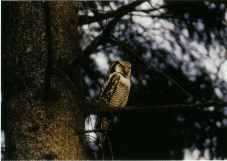
Sperweruil, Westerbork, 31 oktober 2006.