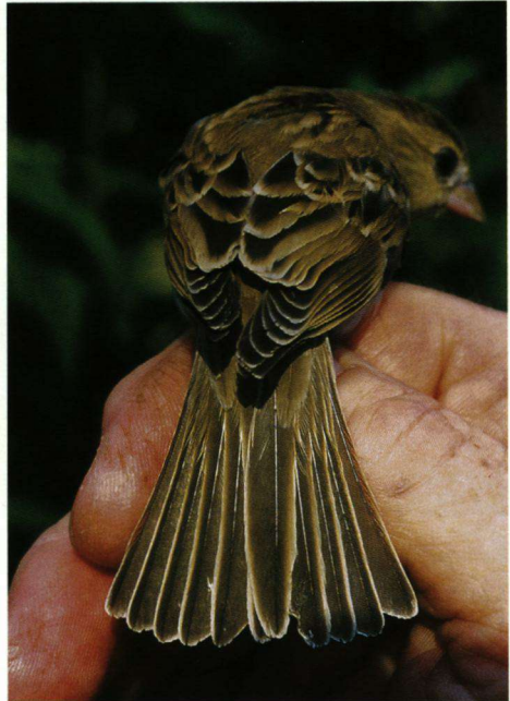
Een Bruinruggoudmus in Eemdijk.

Toen de dia's ontwikkeld waren heb ik er enkele afdrucken van laten maken en deze rondgestuurd naar bevriende vogelaars die er op hun beurt weer mee op stap gingen in vogelaarskringen. Ook heb ik scans van de opnamen per e-mail naar een aantal vogelaars gestuurd. Deze werden hier en