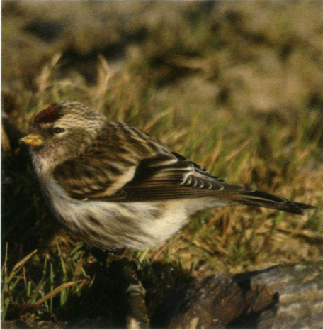
Grote Barmsijs, IJssel bij Zutphen, 3 januari 2006.