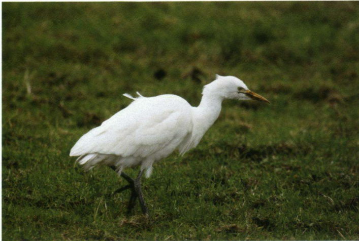
Koereiger, De Klosse, Giethoorn, 4 december 2005.