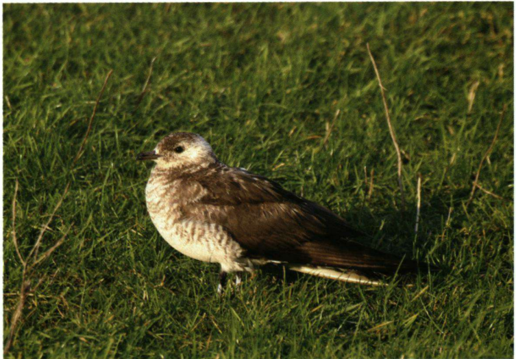
Kleine Jager, De Kwallingen, Werkendam, 1 december 2005.