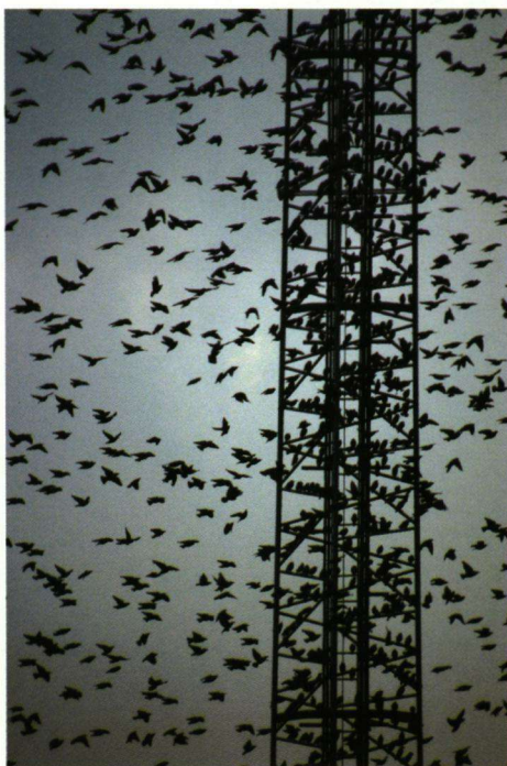
De vogels vechten om de beste plekje bij de zendmast of een hoge boom.

Al enkele jaren verzamelen honderden Spreeuwen zich aan het eind van de zomer op hun vaste slaappleaats in het Huigpark in Leiden om daar de nacht door te brengen. Elke avond komen de vogels vanaf een uur of negen in groepjes van vijftig tot wel vijfhonderd vogels uit noordoostelijke richting aangevlogen. Ze gaan niet direct slapen, maar blijven eerst nog een uur in de omgeving rondvliegen. Kleine groepjes smelten daarbij langzaam samen tot een steeds groter wordende bal die zich als één organisme lijkt te gedragen. Een prachtig schouwspel. Vanaf de bruggen bij het Huigpark en bij de achteringang van de energiecentrale is het tafereel goed waar te nemen. Roelant had net een nieuwe camera gekocht die uiteraard getest moest worden en wat is er mooier dan een enorme troep Spreeuwen bij ondergaande zon om de camera mee te