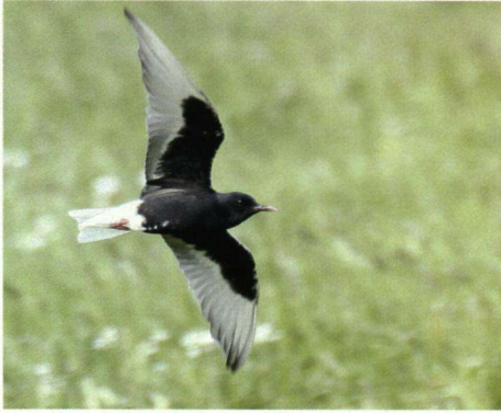
Witvleugelstern Chidonias leucopterus , Celle- muiden (O.), 4 mei 2006.