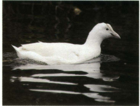
Een volledig leucistische Meerkoet Fulca atra , De Marslanden, Zwolle, 15 april 2006.