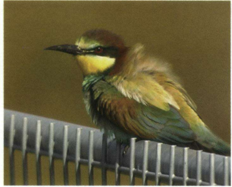
Bijeneter Merops apiaster in Monster.

Op 29 mei 2005 werden er Bijeneters waargenomen in het niet vrij toegankelijke gebied Solleveld in Monster (Z.-H.). In het voorjaar worden wel eens vaker Bijeneters waargenomen, maar bij deze dieren werd copulatie gezien. In verband hiermee werden de vogels goed in de