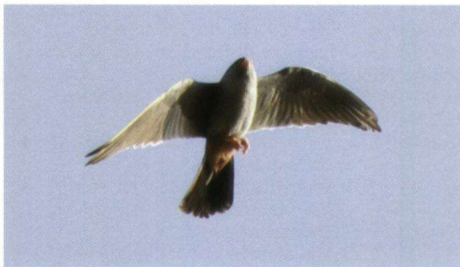
Roodpootvalk Falco vespertinus , Fochteloërveen, adult mannetje, 14 mei 2006.