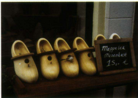
Aangeboden: Meppeler mezenkasten.

Nestkasten zijn te koop in allerlei uitvoeringen, ook al is het overgrote deel daarvan gebouwd op basis van het 'zes-