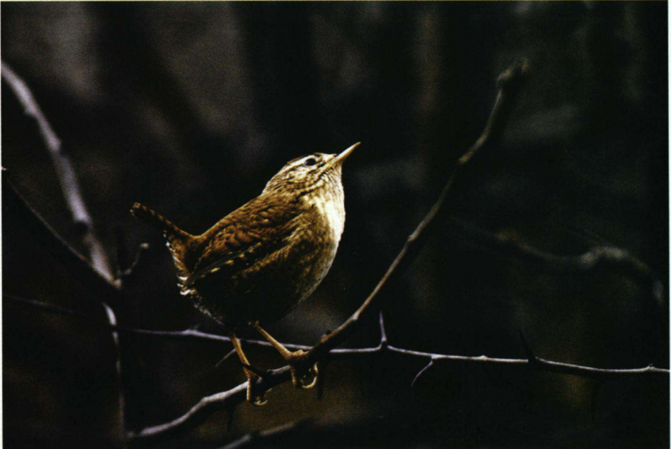
Achtste plaats. Winterkoning Troglodytes troglodytes .

Vrijwel alle inzenders hadden meer dan één foto ingezonden. Over het algemeen was de kwaliteit van de afdrucken goed. Vrijwel alle inzenders hadden gebruikgemaakt van fotopapier van de bekende merken zoals Fuji, Agfa of Kodak. Toen wij een paar jaar geleden deze jaarlijkse wedstrijd voor het eerst hadden opgesteld voor kleurenfoto's, ontvingen wij verscheidene foto's die overduidelijk door