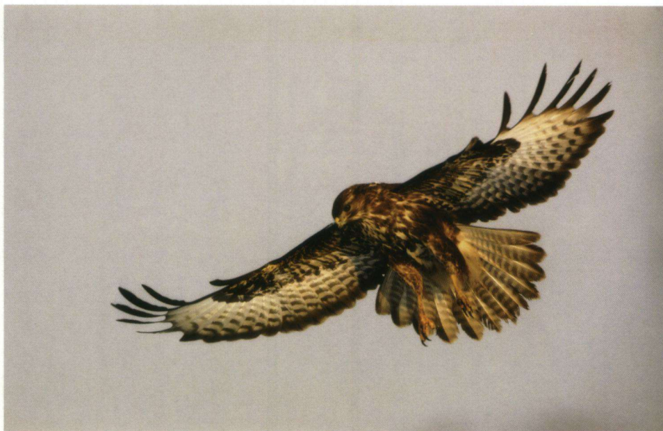
Vierde prijs (ex aequo). Bulzard Buteo buteo .