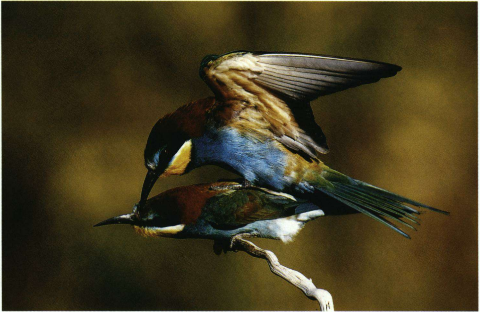
Derde prijs. Parende Bijeneters Merops apiaster op Lesbos.