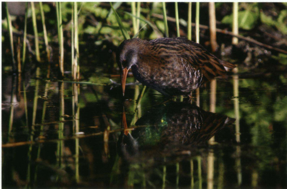
Vierde prijs (ex aequo). Waterral Rallus aquaticus .

De foto van twee parende Bijeneters kreeg de derde prijs. Deze opname werd gemaakt op 28 mei 2006 door Erwin van Laar .