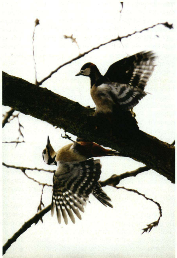
Tweede prijs. Grote Bonte Spechten Dendrocopos major bij Zwolle.

Erwin maakte deze plaat tijdens een verblijf op het Griekse eiland Lesbos in de vroege ochtend, rond halfzeven. De foto is gemaakt met een Nikon lens met een brandpuntafstand van 500 mm en met een 1,4 teleconverter. De camera was een Nikon D70, ingesteld op een gevoeligheid van ISO 320 en met een diafragma ingesteld op F 7,1. De sluitersnelheid was 1/2000 s. De vogels zijn tamelijk fel en opvallend verlicht, waardoor echter de kleuren wel mooi uitkomen. Vermoedelijk is gebruikgemaakt van (invol)flitslicht. Hoewel de koppen wat donker zijn uitgevallen is het oog van de bovenste vogel nog goed zichtbaar. Altijd een punt van aandacht bij vogels die donkere partijen op de kop hebben. Het verenpak van de vogels contrasteert mooi met de gele tinten die overheersen in de achtergrond.