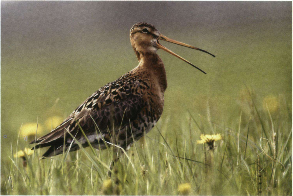
Eerste prijs. Grutto Limosa limosa bij Vorchten.