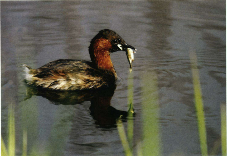
Zesde plaats. Adulte Dodaars Tachybaptus ruficollis .