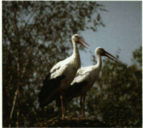
Incidenteel komt het wel voor dat Ooievaars van gelijk geslacht op een nest een broedsel verzorgen.

Mannetjes leggen geen eieren, maar het is waarschijnlijk, dat zij wel tot uitbroeden van ondergeschoven bevruchte eieren kunnen komen en ook de daaruit geboren jongen perfect kunnen grootbrengen. Dit geldt evenzo voor een paartje lesbische vrouwtjes. De eieren moeten dan wel bevrucht zijn! Uit het artikelje meen ik toch te moeten opmaken, dat één van de mannetjes niet zo erg 'homo' is, eerder meer 'hetero'. Of hij moet een kunstje hebben geleerd om bevruchte eieren uit