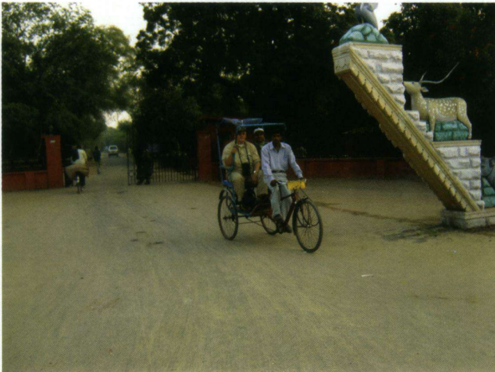
De entree van het Keoladeo Ghana National Park in Barathpur, 2 december 2004.

Als u dit leest is de vogel al vertrokken of opgegeten door een Sperwer of een Havik. Het jonge mannetje haalde overall het nieuws. De druk op het terrein en de wil het vogeltje te zien waren groot. Sommigen vonden dat de vogel te veel achter de veren werd gezeten. Voor een deel kan ik dat beamen, maar ja, ieder die naar dit gebied kwam, had een sterk verlangen de soort te zien. Zo ontstaat er naast vogeltoerisme ook een mate van