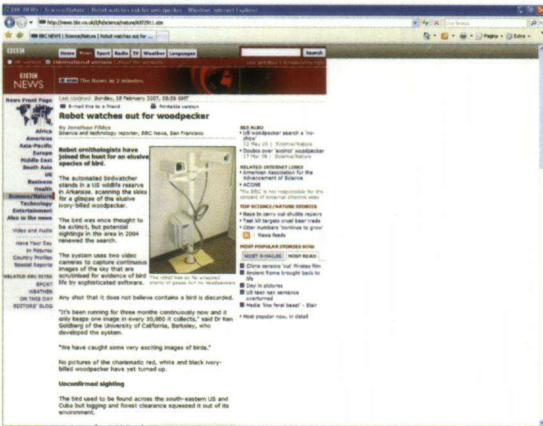
De BBC meldt dat er met een robot wordt gezocht naar de mysterieuze specht in Amerika. Tot nog toe had men met dit staaltje modern vernuft nog geen succes.