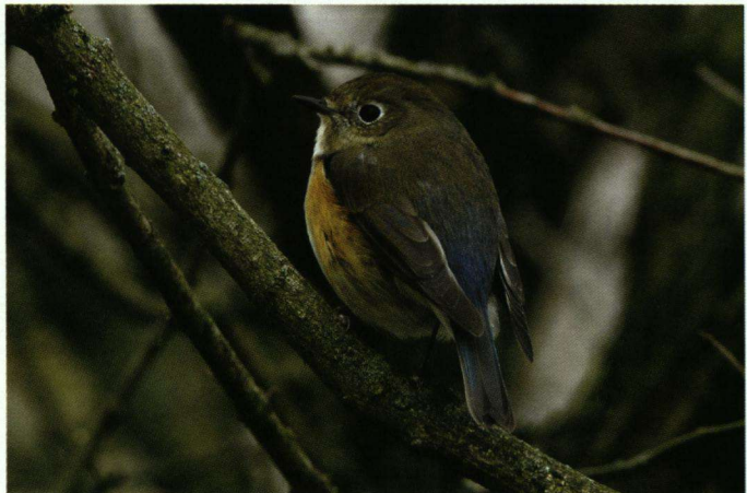
Blauwstaart bij Zandvoort op 20 februari 2007.

Het betreft hier foto's van de Geelpootmeeuw Larus atlantis gibraltariensis . Op deze afbeeldingen is te zien dat deze meeuwen de vruchten van de olijfbomen pikken. Is dit gedrag eerder waargeno-