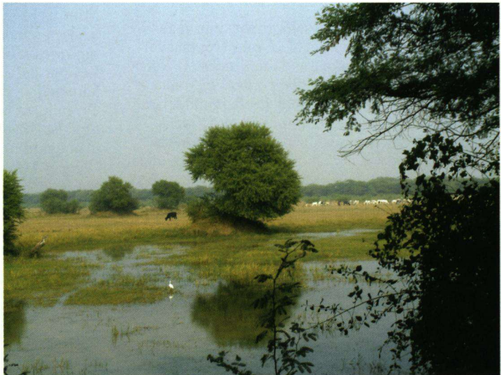
In het nationale park in Barathpur werden in het verleden Siberische Kraanvogels gezien. Opname: 2 december 2004.

Inge Svoboda uit de Verenigde Staten van Amerika bericht mij, naar aanleiding van 'Gieren in India in groot gevaar' (De Digitale Snelweg Nummer 50, het Vogeljaar 53 (3): 121), dat de regeringen van zowel India als Pakistan hebben besloten het gebruik van Diclofenac te verbieden. Een farmaceutisch bedrijf in Nepal produceert een betaalbaar en veilig alternatief voor dit middel: Meloxicam. Als de situatie van de gieren hierdoor weer wordt bevorderd, dan is dit fantastisch nieuws.