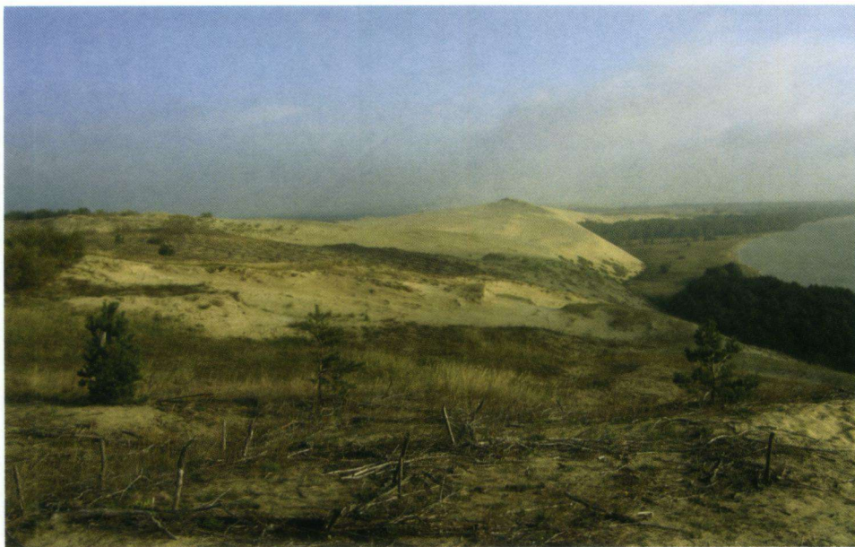
Een deel van de schoorwal in de richting van Litouwen.