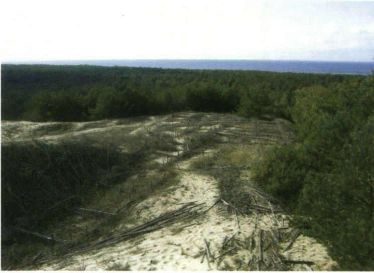
Uitzicht over een deel van de Kurische Nehrung.

tientallen per dag doortrekkend en dagelijks wel enkele Sperwers. Deze laatste (achter)volgden gewoon hun voedselbron. En verder nog een passerende Wespendif op 6 oktober, een Schreeuwarend en een Boomvalk op 3 oktober. Smelleken en Bruine Kiekendief zijn eveneens gezien. Torenvalk en Zeearend waren dagelijkse verschijningen maar niet trekkend. Al met al viel dit wat tegen. Naar uilen is niet uitgekeken. Avond- en nachtwandelingen zijn af te raden, zelfs in de Kurische Nehrung. Rond onze verblijfplaats werd