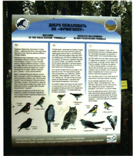
Informatiepaneel bij de ingang van Veldstation Fringilla.