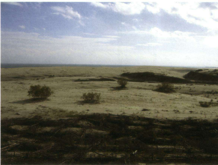
Een kijkje in de richting van het haf.

De bossen zelf – met waarschuwingsschilden tegen teken – herbergen maar een beperkt aantal soorten. Zwarte Mees, Koolmees, Pimpelmees, Matkop, Boomklover, Goudhaan, Winterkoning, Heggenmus, Merel, Roodborst. Geen Kuifmees of Glanskop. Op het getijloze haf viel weinig te beleven. Ik heb alles samen een zestal uren zitten turen, maar er was nauwelijks wat te zien behalve wat Futen, Blauwe