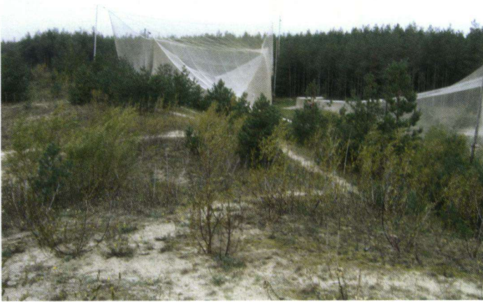
Een detail van de Helgolandinstallatie van Fringilla.

najaarstrek vanuit Finland, de Baltische staten en Noord-Rusland naar het zuidwesten.