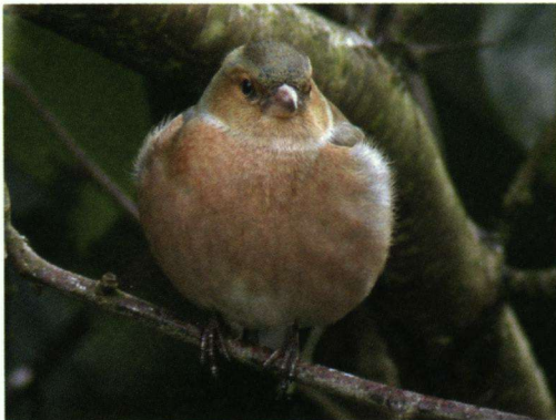
Vinken en diverse andere zangvogels trokken voortdurend in grotere en kleinere golven over.

Gans de Kurische Nehrung is beschermd natuurgebied, maar wat dat precies inhoudt is niet duidelijk. Je kan er niet in – behoudens tegen betaling – en de Russen zelf hebben er geen belangstelling voor. De twee dorpjes Rybachy (900 inwoners) en Morskoi (500)