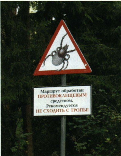
In het bos wordt gewaarschuwd voor teken.

horen. Koperwieken en Kramsvogels zijn maar matig waargenomen en de Grote Lijster ontbrak. Twee dagen was er massale trek van Houtduiven, vooral in de namiddag. Erg opvallend was de dagelijkse trek van Gaaien. Dat verschijnsel speelde zich vaak af in een lange uiteentrokken sliert tot zo'n twintig tot vijftentwintig vogels na elkaar. Vlak boven de boomtoppen, zodat bij onraad snel kon worden weggedoken. Het moest dagelijks om honderden vogels gaan. Leuk was de waar-