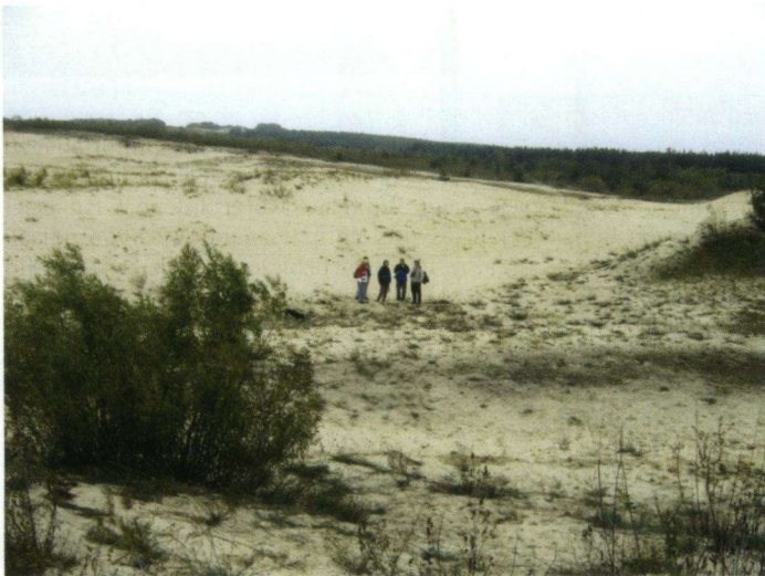
Omgeving van de vangplek in het Veldstation Fringilla.

Onophoudelijk vlogen grote en kleine groepen over. Vaak gaat het om echte golven van langgerekte, dan weer breed uitgetrokken groepen van honderden Vinken, Graspiepers, Sijzen en Veldleeuweriken. Daar zaten steeds Boomleeuweriken, Kepen, Rietgorzen, Barmsijzen, Putters en Kruisbekken tussen en veel Witte Kwikstaarten, (witkoppige) Staartmezen en Pimpelmezen. Af en toe ook een Grote Bonte Specht, een Groenling en een Kneu. Vrijwel de ganse dag was ook regelmatig het 'tsik' van Zanglijsters te