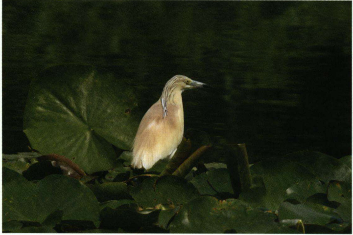
Ralreiger Ardeola ralloides , 6 augustus 2007, Noorderhaven, Julianadorp.