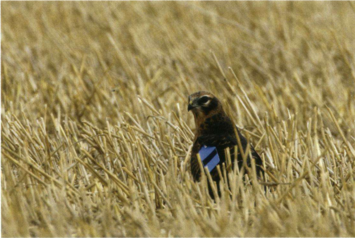
Juvenilele Grauwe Kiekendief Circus pygargus , 14 augustus 2007, Finsterwolde.

broeden, worden ook niet elk jaar juvenielen gezien).