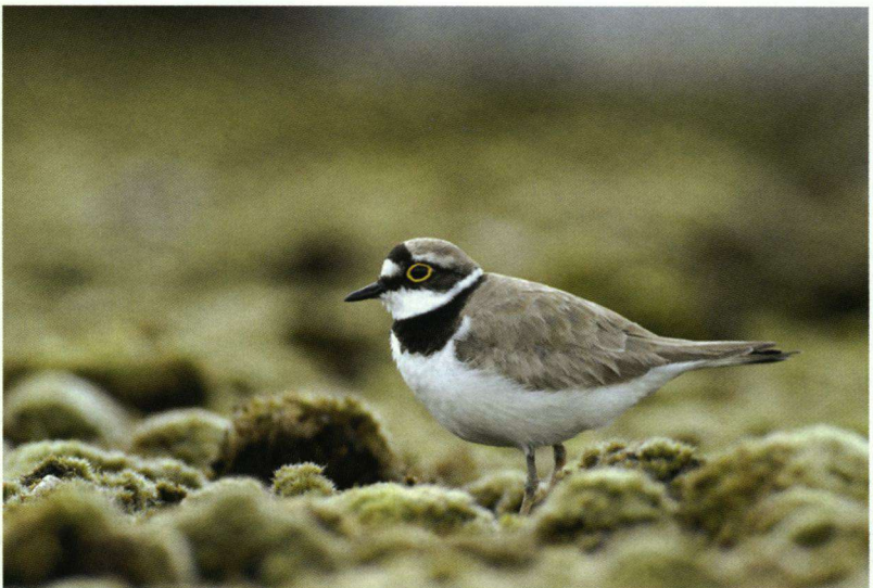
Kleine Plevier Charadrius dubius , 17 juli 2007, Zwaagwesteinde.