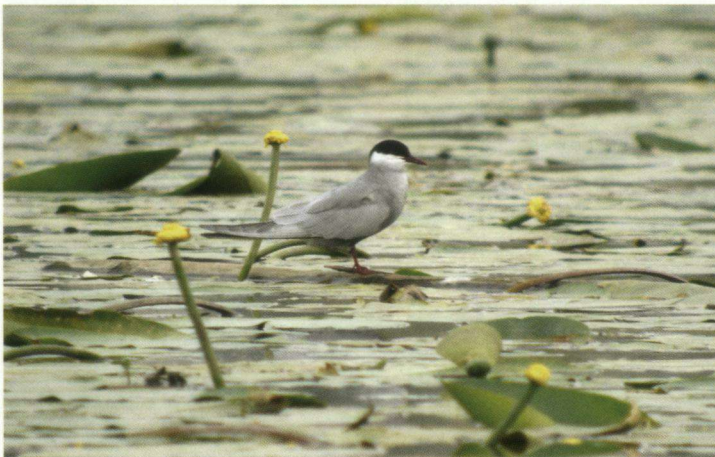
Witwangstern Chlidonias hybrida , 19 mei 2007, Jezuïtenwaal, Groessen.

16-06-07 1 Fochteloërveen (Fr.). M. Stienstra. Vrouwtje.