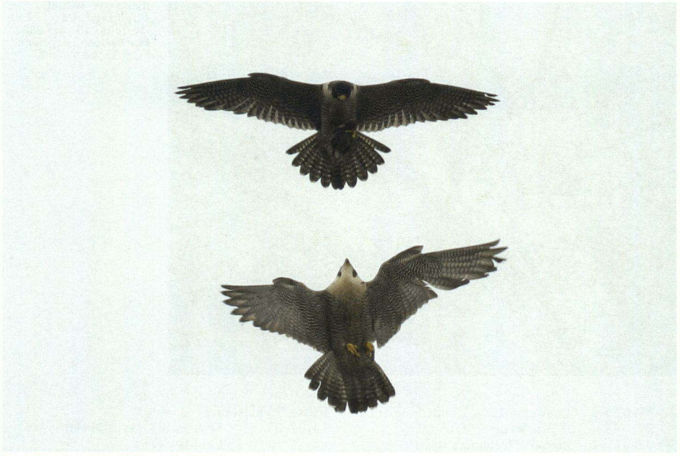
Een paartje Slechtvalken bezig met een prooioverdracht, 13 juni 2007, Deventer.