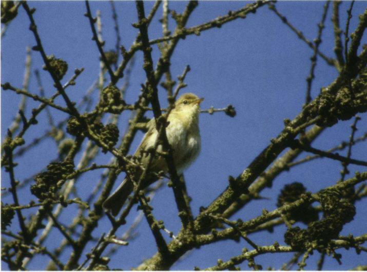
Iberische Tjiftjaf Phylloscopus ibericus , 15 mei 2007, Warnsborn, Arnhem.

22-07-07 2 Lauwersmeer - Vlinderbalg (Fr.). P. van Wetter.