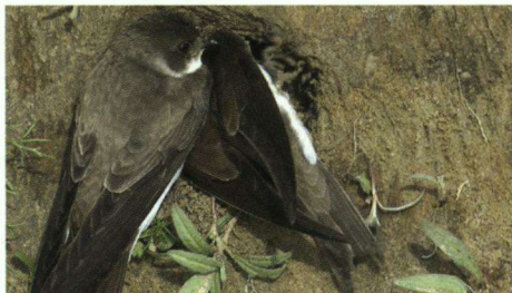
Oeverzwaluwen bij het maken van de nestgang tijdens fase 3.

Als de vogels aan de wand aankomen, verkennen ze eerst de grond van de wand door er tegenaan te gaan zitten, hangend aan hun nagels en steunend op hun staart. Daarbij krabben zij met hun snavel over de wand om te kijken of de plek geschikt is om er een nestgang te gaan maken. Is deze naar hun mening goed, dan maken zij met hun snavel een eerste begin, een klein kuiltje.