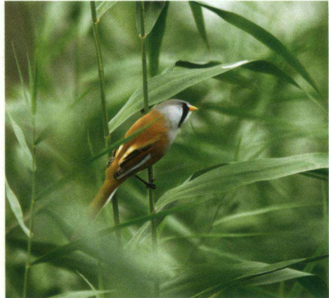
Baardman in Zuidelijk-Flevoland, 14 oktober 2006.

De Baardman is een 'jaarvogel', hetgeen betekent dat hij het gehele jaar door waargenomen kan worden. In oudere boeken werd hij Baardmees genoemd, maar hij is in het geheel niet verwant aan de mezen. De vogel waarnemen is erg lastig, omdat ze voortdurend in beweging zijn. Het kenmerkende geluid dat ze maken, is vaak het eerste dat ons opmerkzaam maakt op deze rietbewoners. Wanneer je ze kan fotograferen is dat echt een gelukje. In de zomer zijn ze op zoek naar insecten en in de winter schakelen ze over op plantaardig voedsel, meestal rietzaden. In het algemeen beginnen ze met het eten van zaden na de rui. Ook de jongen hebben een voorkeur voor plantaardig voedsel. Het is op zich heel bijzonder dat een dier, in dit verband een vogel, over kan stappen van een insectivoor dieet naar een herbivoor dieet. Daarvoor moet de zaak binnenin wel aangepast worden. In het voorjaar schakelen ze dan weer over op insecten. Ze komen in de problemen als een zacht voorjaar wordt gevolgd door een koude periode. Hun maag kan dan niet snel even omschakelen op plantaardig materiaal en