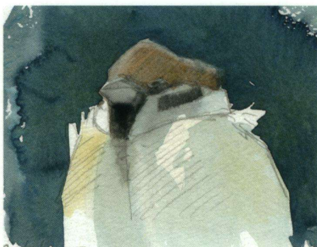
Illustratie: Dirk Moerbeek.

n tot 1 vindt men mogelijk ook bij het Katrielmuschje, dat overigens bij de drukker van Daalders Vogelkiekjes (1910) nog verdere duivelse verbastering onderging: daar is het een Katuilmuschje geworden. Katrienmuschje dan? Maar wat heeft Catharina met deze vogel te maken? Mede vanwege Duits Ringelspatz herkennen we de soort in Ringel-mus nog wel; bij Ringel-duts en Ringeltute wordt het al lastiger. En wat is een Kringleunink? Inderdaad, het is (of was) de Ringmus in Winterswijk; leunink is een Saksisch woord voor 'mus'.