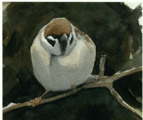
Illustratie: Dirk Moerbeek.

Tuinmus noemt men hem nog steeds in Zuid-Limburg, maar dan met de oer 'oe' die in Achterhoeks en Gronings hoes ('huis') ook nog zit: Toenmusj. Bijna niet meer te herkennen. En het wordt nog erger, als men in plaats van een n een l uitspreekt in Toelmusj. Je zou dan bijna aan het Engelse 'tool' (gereedschap) gaan denken en daarbij maak je je voorstellingen als bij de Galapagosspechtvink (van Darwin), die met een zelfgeplukte cactusstekel larven uit hun diepe gangen in het hout peutert. Zo'n verbastering van