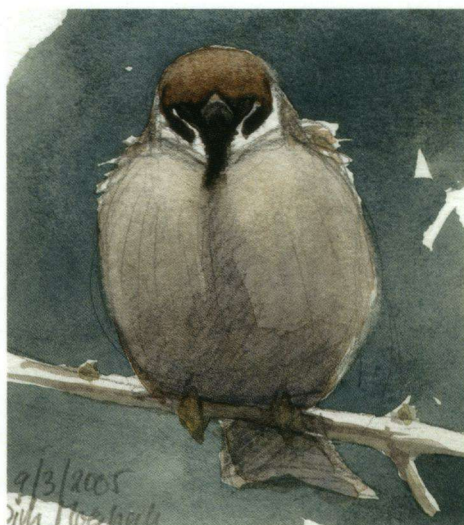
Illustratie: Dirk Moerbeek.

Als je de namen in moeilijkheidsgraad opbouwt, wil je de naam aan het eind van de serie nog wel herkennen en érkennen. Maar als je de moeilijkste van een serie gelijk op tafel gooit staat de tegenstander