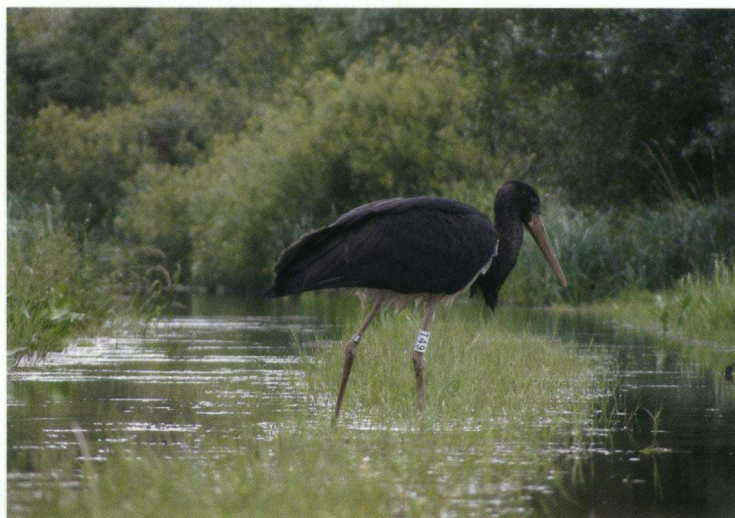
Eén van de 118 Zwarte Ooievaars die in Duitsland van ringen zijn voorzien.

blackstork@web.de, telefoon: +49 399 77 301 04.